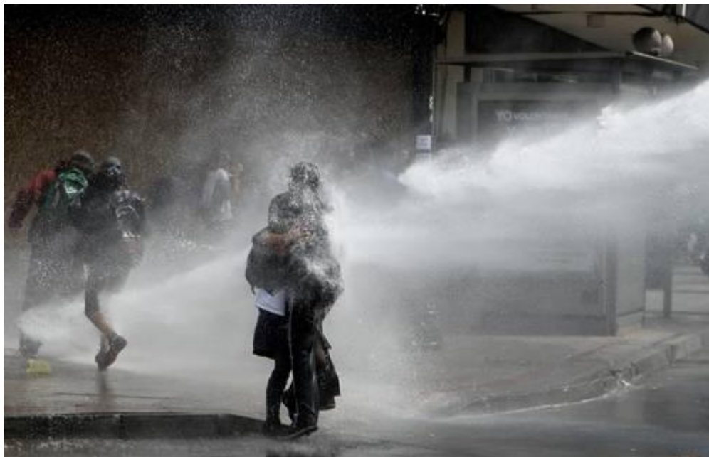
LA POLICÍA ANTIDISTURBIOS DE CARABINEROS REPRIME EN SANTIAGO LA PROTESTA CONVOCADA POR LOS ESTUDIANTES CONTRA LA PÉSIMA EDUCACIÓN TÉCNICA.

• Denuncia la líder Camila Vallejo el “terrorismo de Estado” de Sebastián Piñera