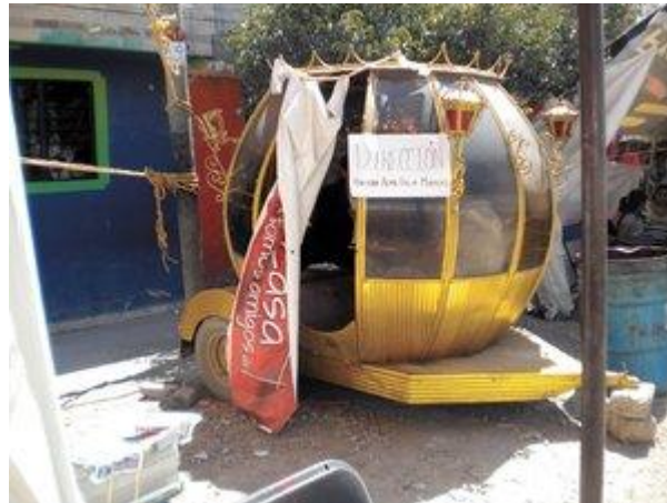
PROVISIONAL. UNA CALABAZA ES UTILIZADA COMO DIRECCIÓN

CHIMALHUACÁN, Méx.— Profesores de la secundaria 678 Juana de Asbaje y Ramírez Santillana —donde se registró el sábado pasado un enfrentamiento entre miembros de organizaciones priístas— exigieron a la Secretaría de Educación mexiquense que les regrese la escuela que permanece cerrada luego de los hechos violentos.