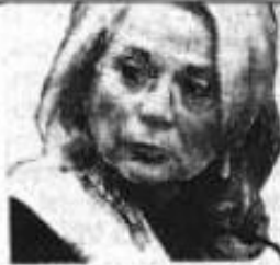
OLGA SÁNCHEZ CORDERO