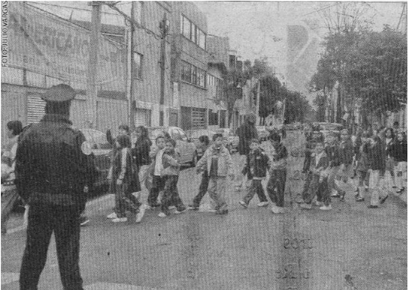
» LOS PEQUEÑOS estudiantes fueron desalojados en orden con la supervisión de profesores y miembros de SSP.