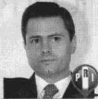
ENRIQUE PEÑA NIETO MAÑANA Y LUNES

Cada viernes y martes, este diario publica las actividades que tendrán funcionarios y políticos que han manifestado sus aspiraciones a contender por la Presidencia de la República en 2012.