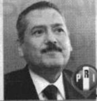
MANLIO FABIO BELTRONES FIN DE SEMANA

VA A CONSEJO PRIISTA Acudirá mañana al Consejo Político Nacional del PRI y el próximo lunes estará en Chihuahua para participar en los foros organizados por la Fundación Colosio.