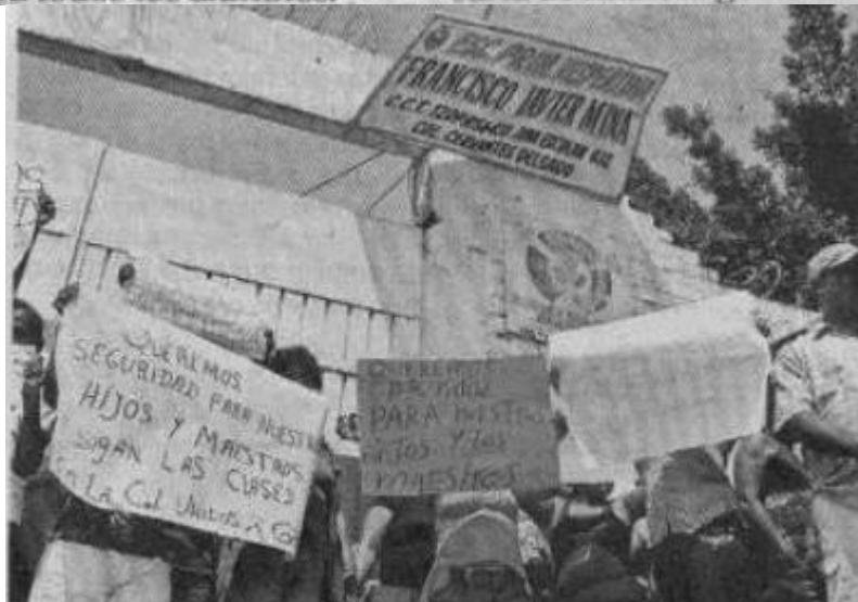
> Padres de familia se manifestaron afuera de la escuela Francisco Javier Mina, en Acapulco, para exigir seguridad.

Un día antes, autoridades estatales aseguraron que el 90 por ciento de los profesores de Acapulco que estaban en paro de labores desde unas semanas antes, ya habían reiniciado sus actividades docentes y que el resto regresaría de manera gradual.