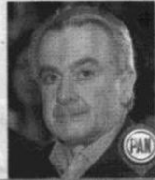
SANTIAGO CREEL HOY Y MAÑANA

GIRA POR ESTADOS El ex secretario de Hacienda viajará este viernes a San Luis Potosí, donde se reunirá con panistas de Tamazunchale y Ciudad Valles. El sábado estará en Jalisco en La Barca y Guadalajara y el domingo se reunirá con militantes de Cuajimalpa, DF.