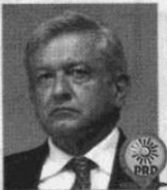
ANDRÉS MANUEL LÓPEZ OBRADOR FIN DE SEMANA

VISITA A VERACRUZ Este viernes encabeza la entrega de tarjetas del programa Prepa Sí UNAM. El domingo, el mandatario capitalino realizará una gira por los estados de Michoacán y Veracruz.