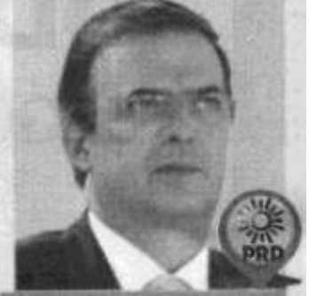
MARCELO EBRARD HOY Y EL DOMINGO

AUMENTA ACTIVIDADES Este viernes realiza diversas actividades privadas. El sábado acude a la instalación del Consejo Político Nacional del PRI y el lunes va a Chihuahua al foro de la Fundación Colosio.