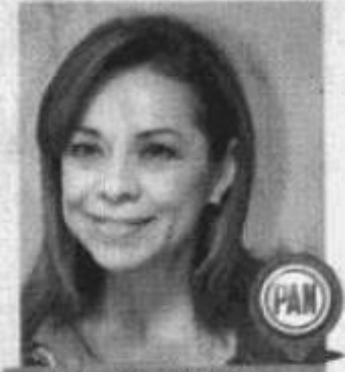
JOSEFINA VÁZQUEZ MOTA FIN DE SEMANA

VA A OAXACA El senador con licencia del PAN tendrá este viernes reuniones internas con comités de apoyo en el Distrito Federal y se prevé que este sábado inicie una visita por el estado de Oaxaca, para reunirse con panistas de aquella entidad.