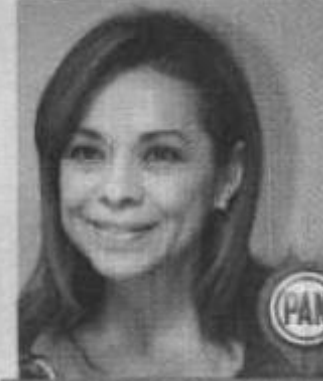
JOSEFINA VÁZQUEZ MOTA

El senador con licencia tendrá una agenda privada hoy. Mañana ofrecerá una conferencia de prensa en el DF, y por la tarde se trasladará a Atlacomulco, para reunirse con panistas mexiquenses.