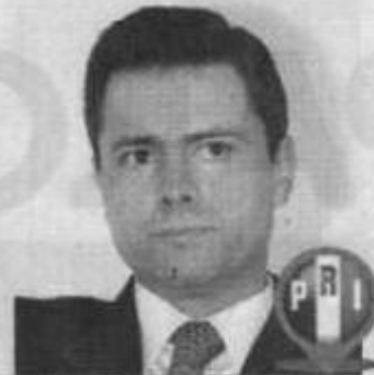
ENRIQUE PEÑA NIETO

Cada viernes y martes, este diario publica las actividades que tendrán funcionarios y políticos que han manifestado sus aspiraciones a contender por la Presidencia de la República en 2012.