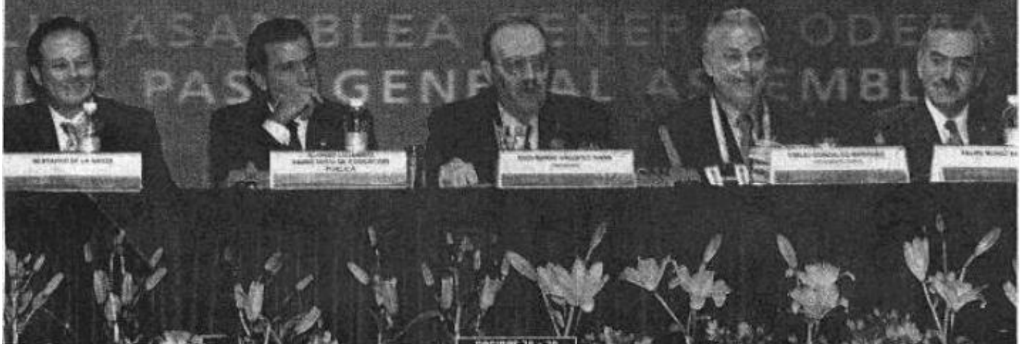
ALONSO LUJAMBIO INAUGURO LA ASAMBLEA DE ODEPA

• Con la representación del Presidente de la República, Felipe Calderón Hinojosa, el Secretario de Educación Pública, Alonso Lujambio, inauguró la XLIX Asamblea General de la Organización Deportiva Panamericana, donde destacó la importancia del deporte en el mundo