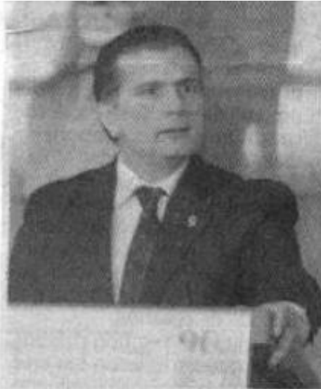
APERTURA. El secretario de Educación Pública, Alonso Lujambio