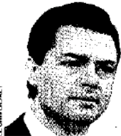
ENRIQUE PEÑA NIETO

EN POCOS días uno de los hombres de las con-