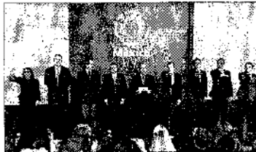
En plena transformación. Con estos cambios, el Presidente hizo el movimiento número 23 en su gabinete.