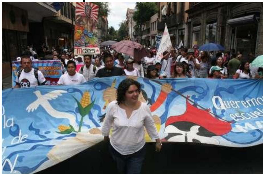
INTEGRANTES DEL MAES DURANTE LA MANIFESTACIÓN QUE CULMINÓ EN EL CENTRO HISTÓRICO.