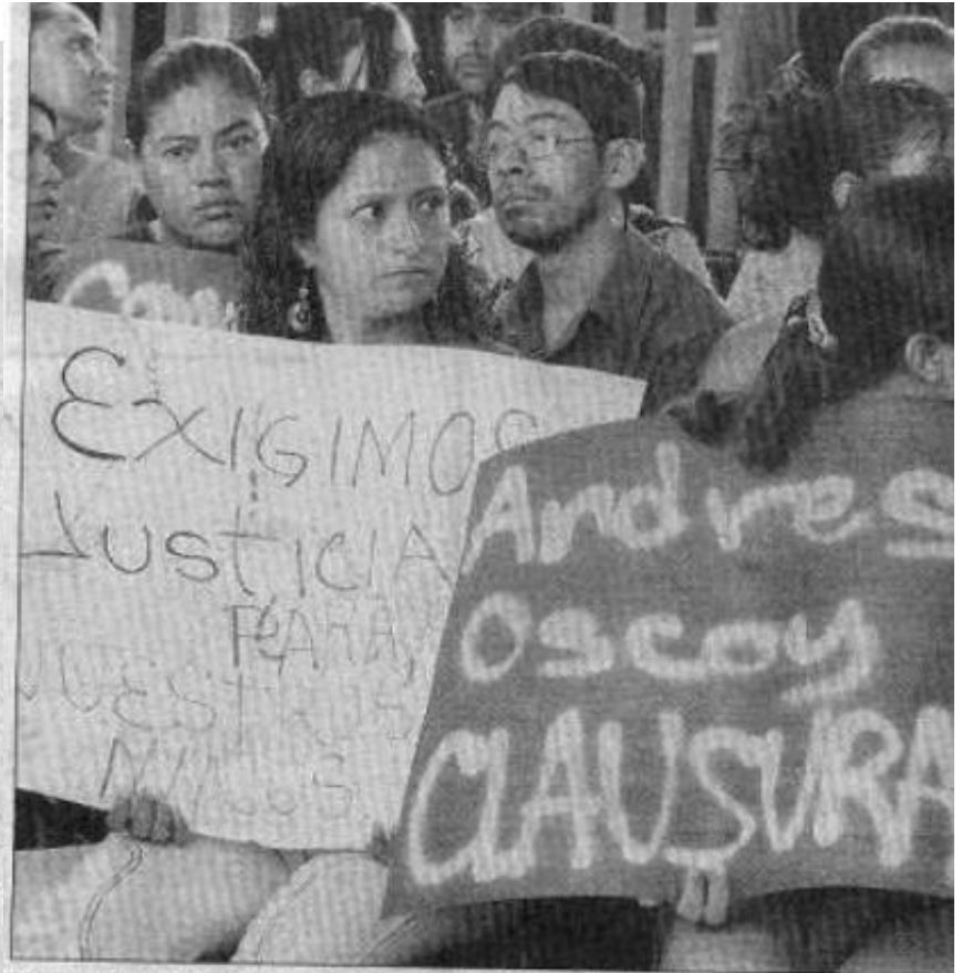
LUCHA. Padres de familia manifiestan su inconformidad por el abuso a sus hijos.