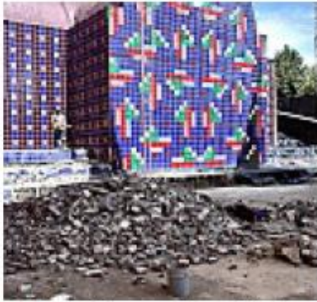
> El mural de mosaico multicolor de Vicente Rojo será también restaurado.