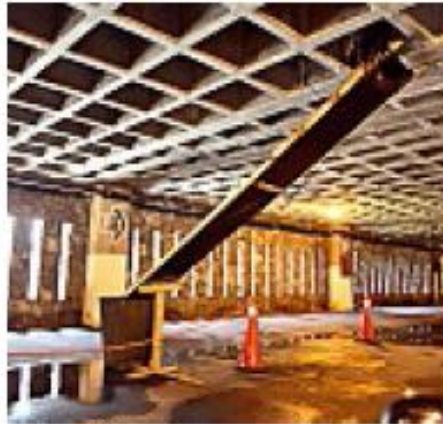
> Las filtraciones en el estacionamiento exigieron colocar esta rampa improvisada.