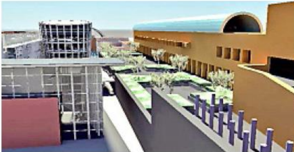
> En esta imagen digital se observa la columnata morada que se ubicará en el pasillo que va de la Plaza de las Artes a la Plaza Central.