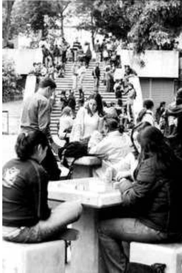
ESTUDIANTES DE LA FACULTAD DE CIENCIAS POLÍTICAS Y SOCIALES DE LA UNIVERSIDAD NACIONAL AUTÓNOMA DE MÉXICO.

Los jóvenes, agregó, están “transformando el mundo y reinventando la cultura. Deben poseer las capacidades y herramientas que les permitan actuar y estrechar los vínculos entre culturas y proteger” las garantías esenciales.