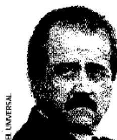
JOSÉ ÁNGEL CORDOVA

JOSÉ ÁNGEL CORDOVA , secretario de Salud,