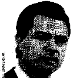
ENRIQUE PEÑA NIETO

EL FESTEJO por el 49 aniversario del presidente