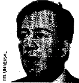
JOSÉ ANTONIO MEADE

JOSE ANTONIO MEADE , secretario de Ener-