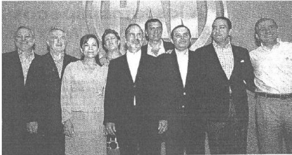
Gustavo Madero Presidente nacional del PAN

“No estamos de ninguna manera anticipando ningún proceso, lo único que estamos es intensificando el diálogo, el acercamiento, la motivación y la comunicación entre los distintos actores del PAN”