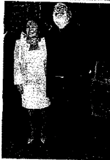
La líderesa y Fernando Savater

"La educación es tarea de todos. Invitamos a todos: padres, gobiernos locales, federal a que le entremos en serio a una gran discusión. Tenemos claro en el