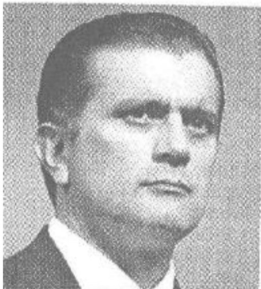
ALONSO LUJAMBIO, Titular de la Secretaría de Educación Pública

Inició su cuenta el 22 de mayo de 2010; sus "tweets" ascienden a 527; hasta ayer, el encargado de las políticas educativas en el país tenía 32 mil 578 "followers".