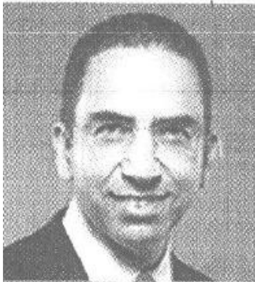
JAVIER LOZANO, Secretario del Trabajo y Previsión Social

Se describe en la red social como "poblanco, abogado y maestro de la ELD. Pianista y aficionado a: lectura, música, ópera, deporte, las Chivas y Tintán". Tiene 40 mil 517 seguidores; ha enviado 12 mil 632 comentarios, y abrió su cuenta el 9 de mayo de 2010.