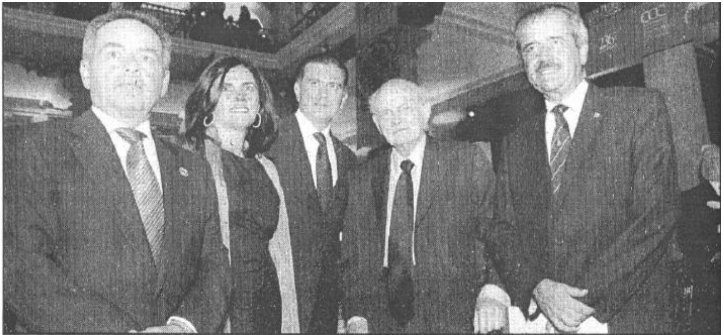
Personalidades del mundo empresarial y político, entre ellos los secretarios de Educación Pública, Alonso Lujambio, y de Salud, José Angel Córdova , reconocieron el trabajo de las instituciones de asistencia privada.