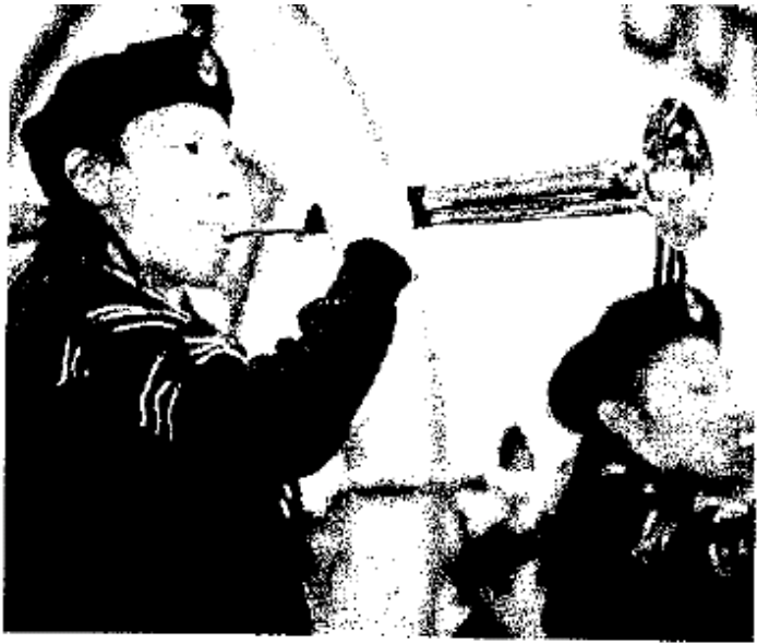
FIESTA. Banda de guerra de la secundaria número 2