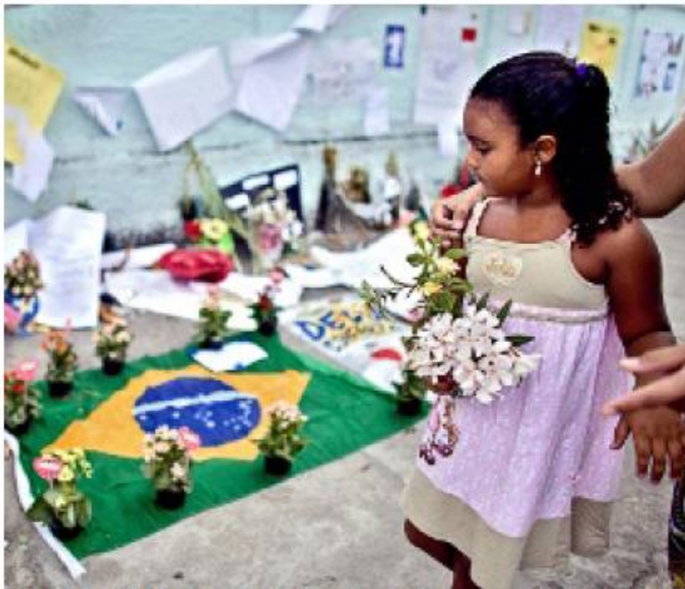
> Unas 2 mil 500 personas de todas las edades homenajearon ayer a los niños fallecidos por el tiroteo del 7 de abril en la escuela Tasso Silveira.