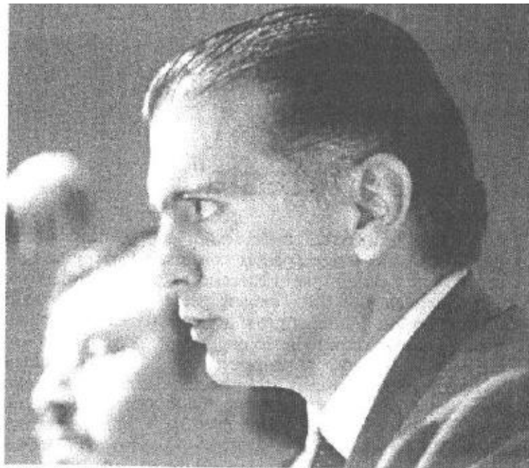
DISCURSO. Alonso Lujambio ayer durante su participación en la Universidad Iberoamericana campus ciudad de México