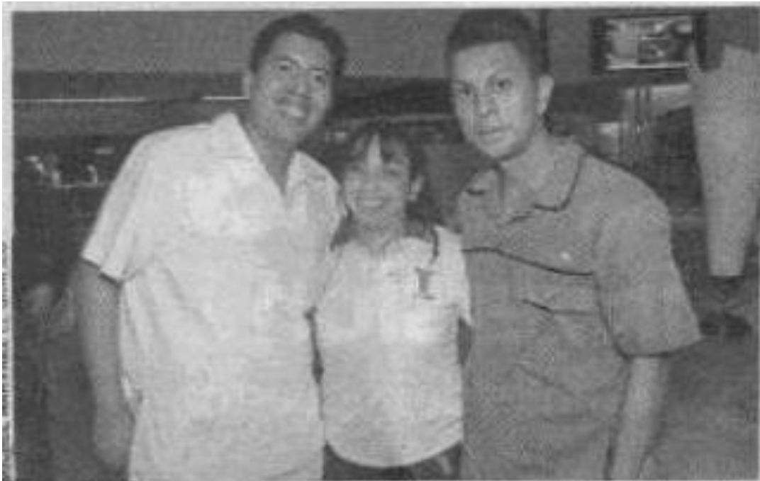
Ambos agradecen poder valerse por sí mismos en un empresa