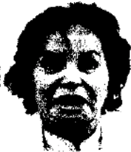
ELBA ESTHER GORDILLO