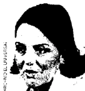
MARÍA DEL CARMEN ALANÍS

LA CENA que la magistrada presidenta del Tribunal Electoral, María del Carmen Alanís , ofreció en su casa con políticos cercanos al gobernador Enrique Peña Nieto sigue resonando en la institución, que en agosto próximo debe reelegir a la magistrada Alanís o dar lugar a un relevo. Ese parece ser ya el motivo del jaloneo interno. Uno de los más inquietos es el magistrado Constancio