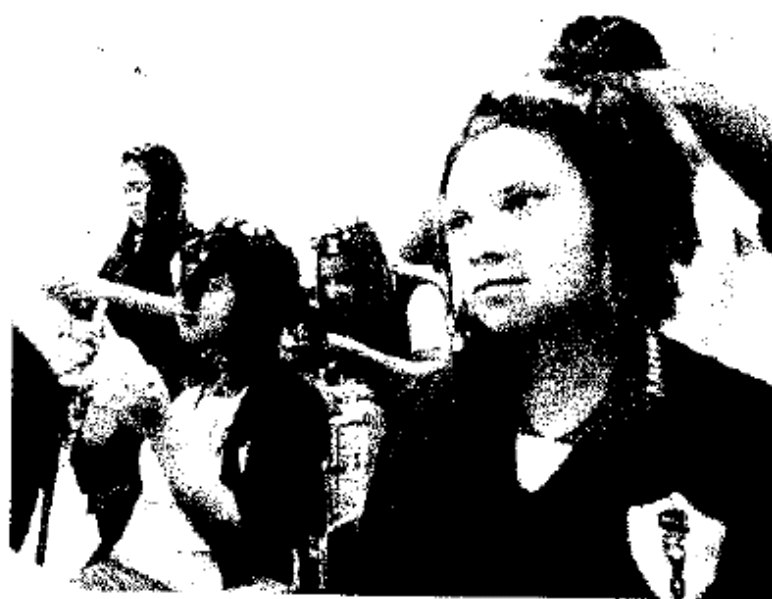
ESTÉTICA. Además de manualidades, las niñas aprenden belleza