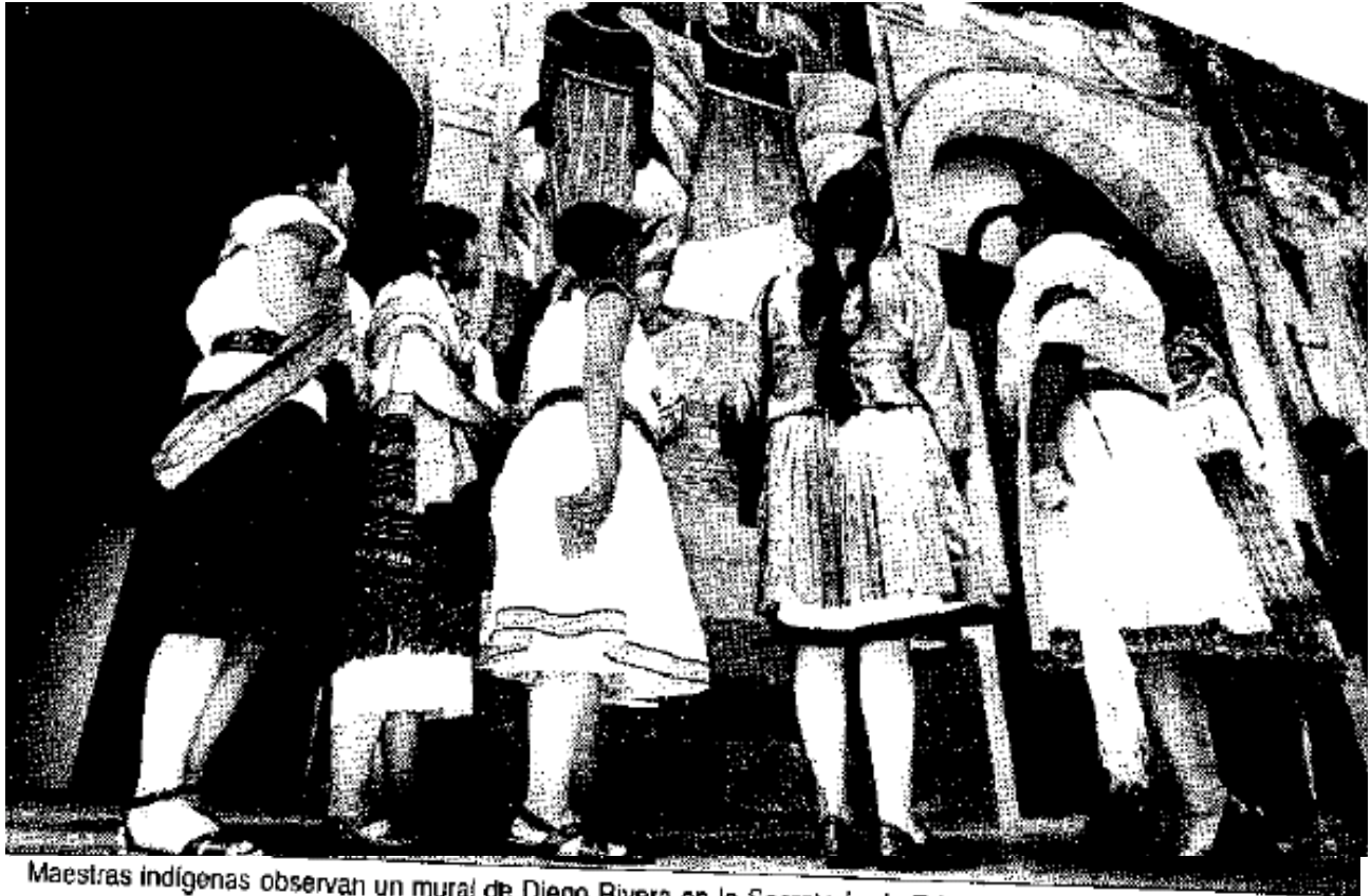
Maestras indígenas observan un mural de Diego Rivera en la Secretaría de Educación Pública, luego de una ceremonia con motivo del Día Internacional de la Mujer