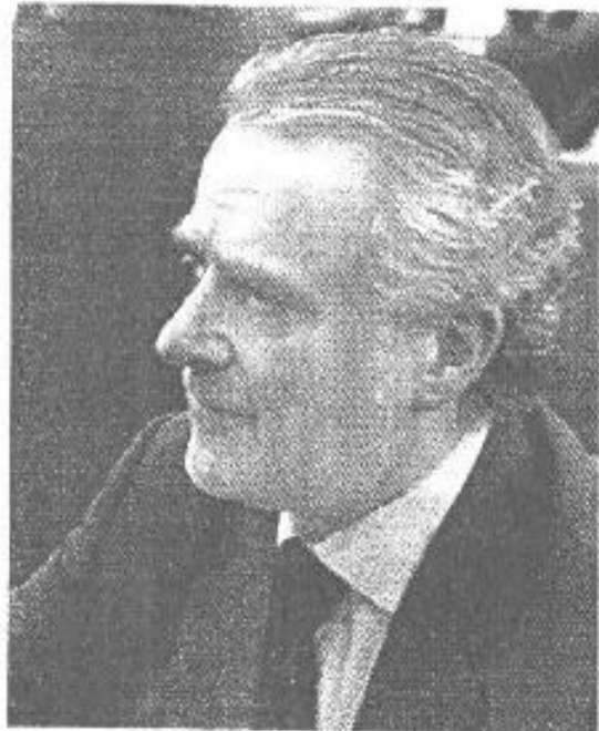
Santiago Creel Senador panista

“ Me parece muy saludable que el Presidente abra esta discusión, somos un partido que siempre ha estado abierto a la ciudadanía ”