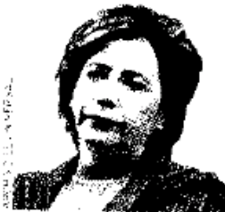
LUISA MARÍA CALDERÓN

panista en Michoacán se puso tan peliaguda que la dirección del partido le pasó por encima al encargado de poner paz, el ex legislador Juan José Rodríguez Prats . El Comité Ejecutivo Nacional que encabeza Gustavo Madero se hará cargo del proceso interno para la selección de su candidato. ¿Cuál es el problema?, se preguntará usted. Luisa María Calderón , hermana del presidente Felipe Calderón , y el senador