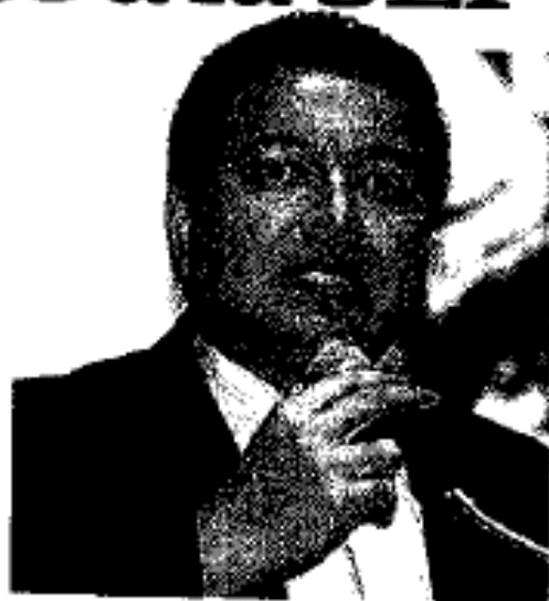
MARIO DELGADO demanda a la SEP trabajo conjunto.

Al conmemorar el Día Internacional de la Mujer, Delgado Camillo manifestó: "no podemos creer que podamos tener visiones tan cortas ni ser tan intolerantes en el tema de la educación. Debriamos trabajar