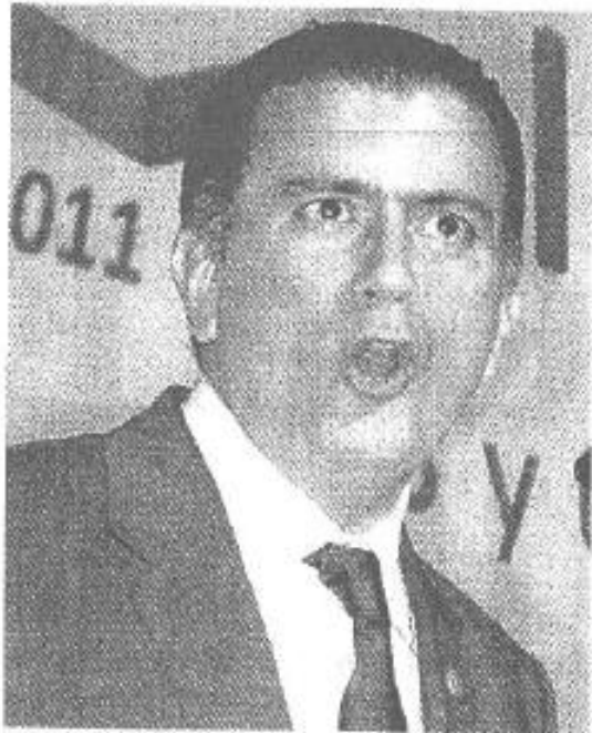
Alonso Lujambio Titular de la SEP

ALONSO LUJAMBIO aseguró que en su partido “la caballada está absolutamente fuerte y no lo digo por mí, lo digo por mis colegas”