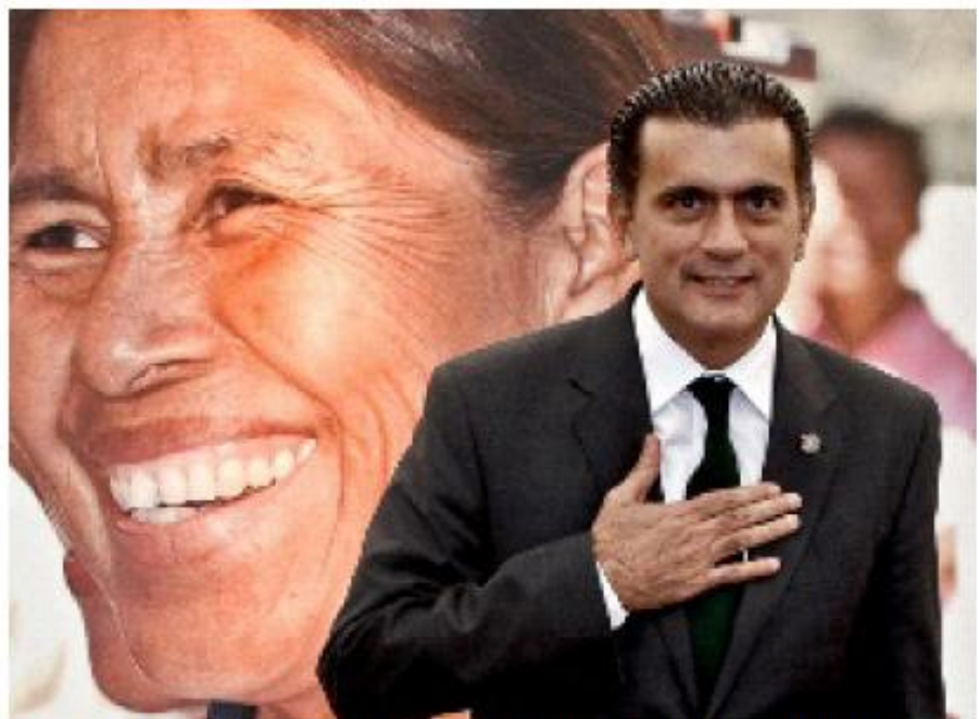
> “La caballada está fuerte. Hay extraordinarios cuadros”, presumió el titular de la SEP, Alonso Lujambio.

Puedo decir que mi ciclo de valoración ha terminado y se abre una nueva etapa de definición y de claridad respecto a mi pretensión frente a 2012. Lo que queda ahora es construir esta propuesta y este acercamiento con todos los militantes panis-