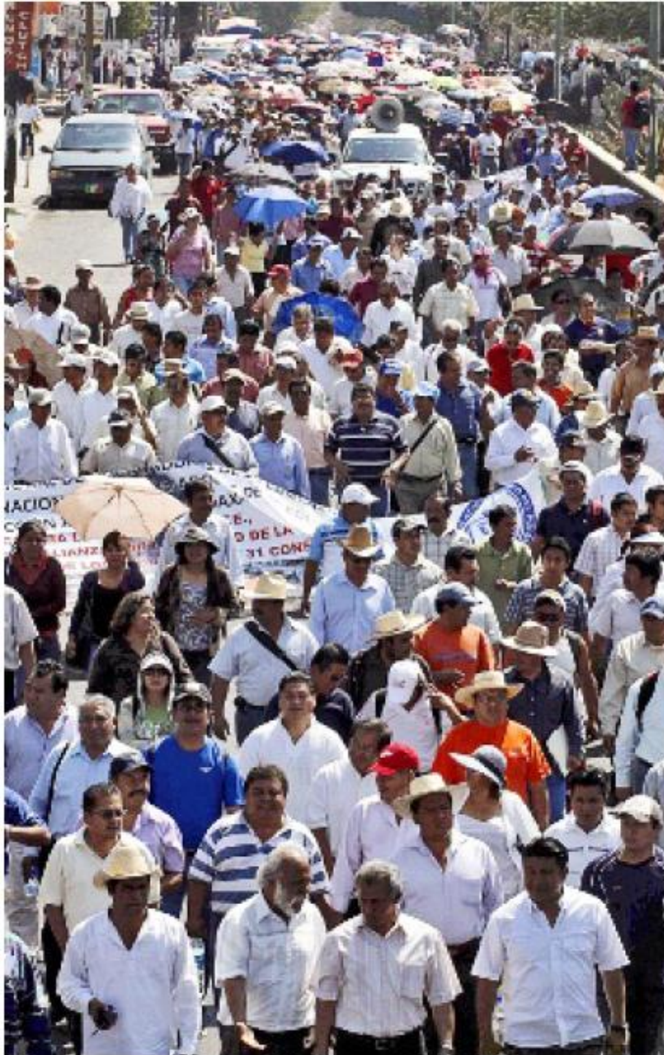
> Los maestros oaxaqueños de la Sección 22 del SNTE caminaron por las principales calles de la capital y se manifestaron en el zócalo.