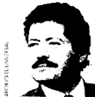
LUIS DONALDO COLOSIO

EL ANIVERSARIO luctuoso 17 de Luis Donaldo