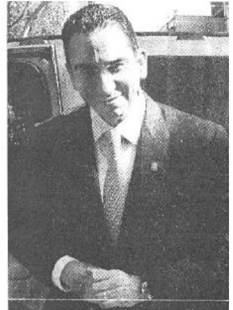
JAVIER LOZANO ALARCÓN, secretario del Trabajo