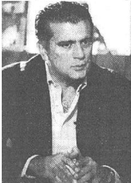
ALONSO LUJAMBIO IRAZÁBAL, secretario de Educación