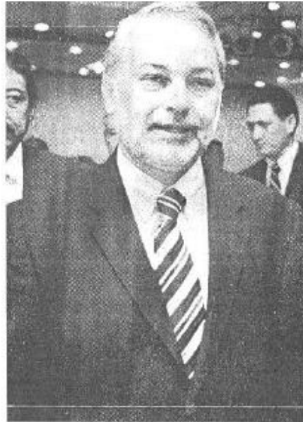
EMILIO GONZÁLEZ MÁRQUEZ, gobernador de Jalisco