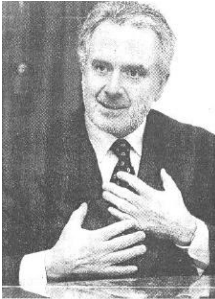
SANTIAGO CREEL MIRANDA, senador de la República