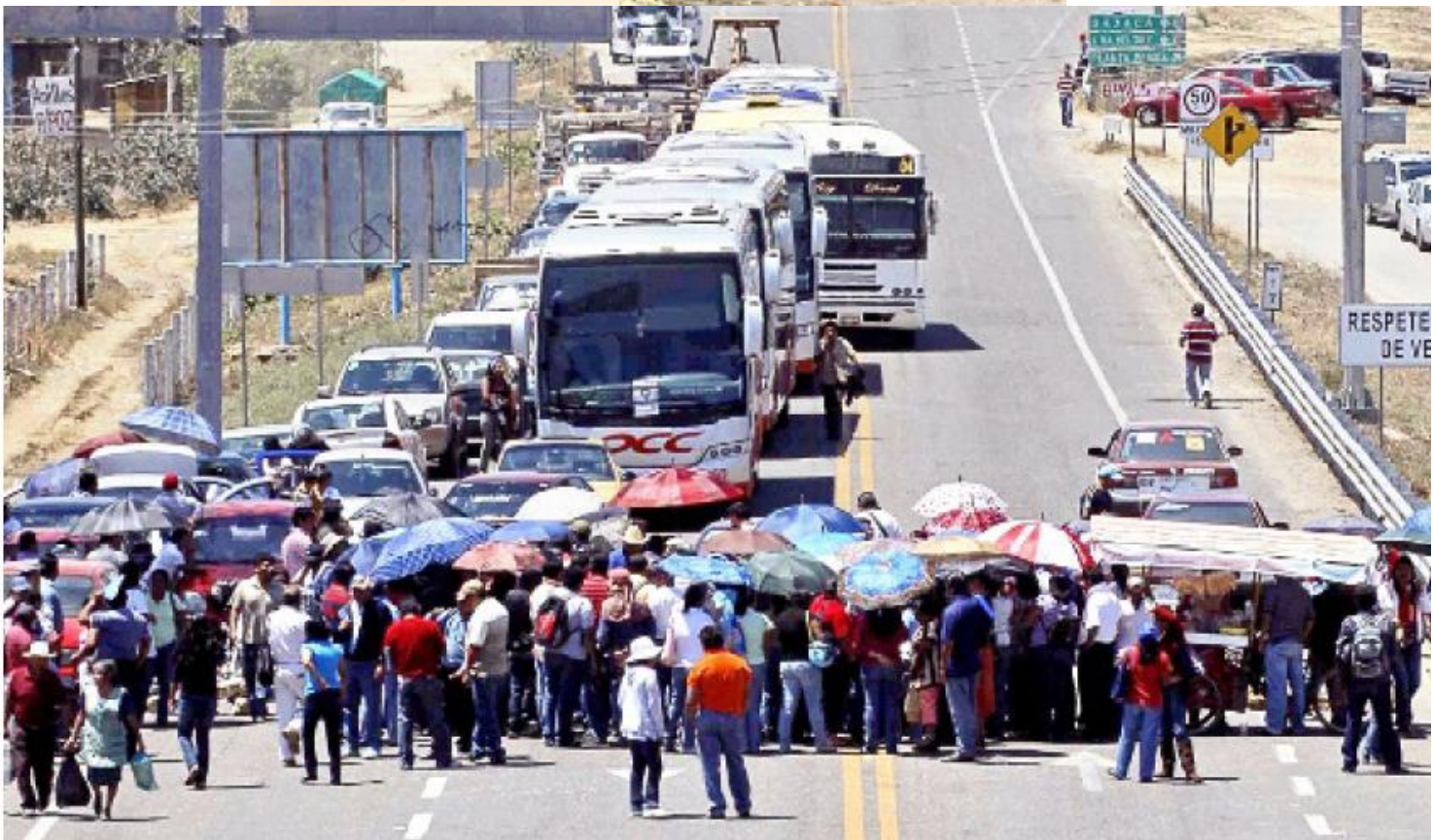
PROHÍBEN PASO. Maestros de la Sección 22 del SNTE impidieron la circulación en diferentes tramos carreteros durante cinco horas.