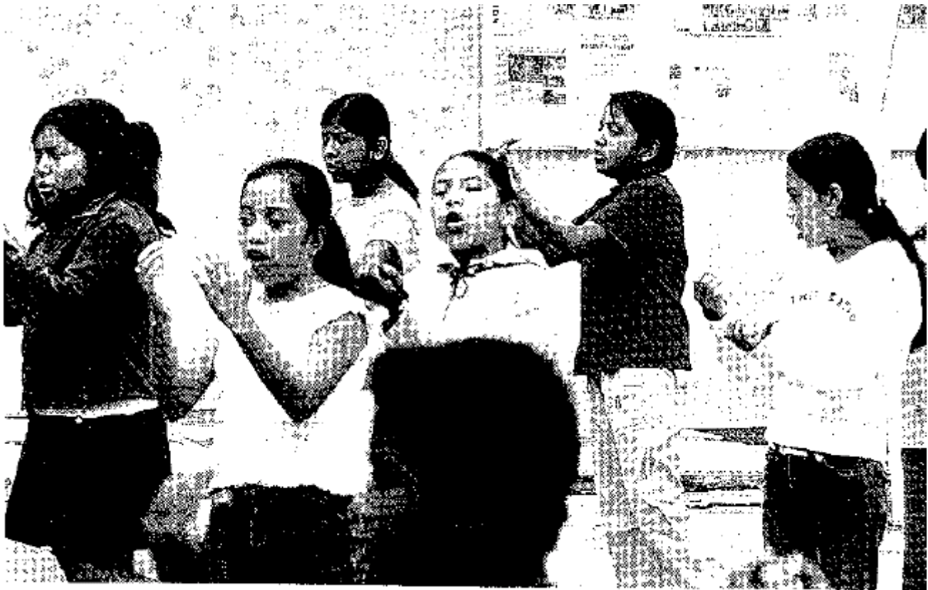
Los Infantes podrán acudir por la mañana y por la tarde a realizar sus trámites