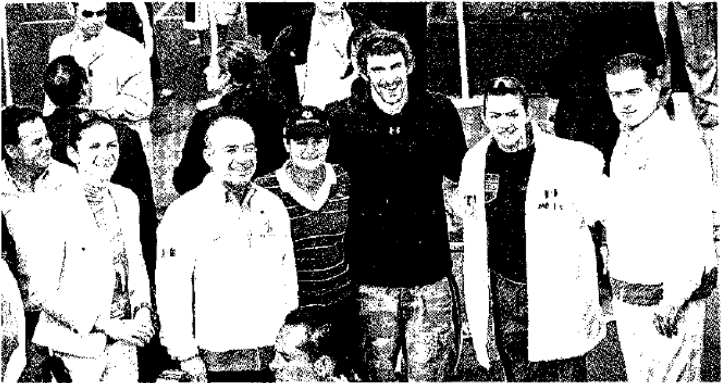
Michael Phelps fue la máxima atracción del Festival Olímpico Bicentenario que se celebró el 9 y 10 de octubre en Paseo de la Reforma. Según información de Conade el tritón estadounidense cobró 100 mil dólares por presentarse.