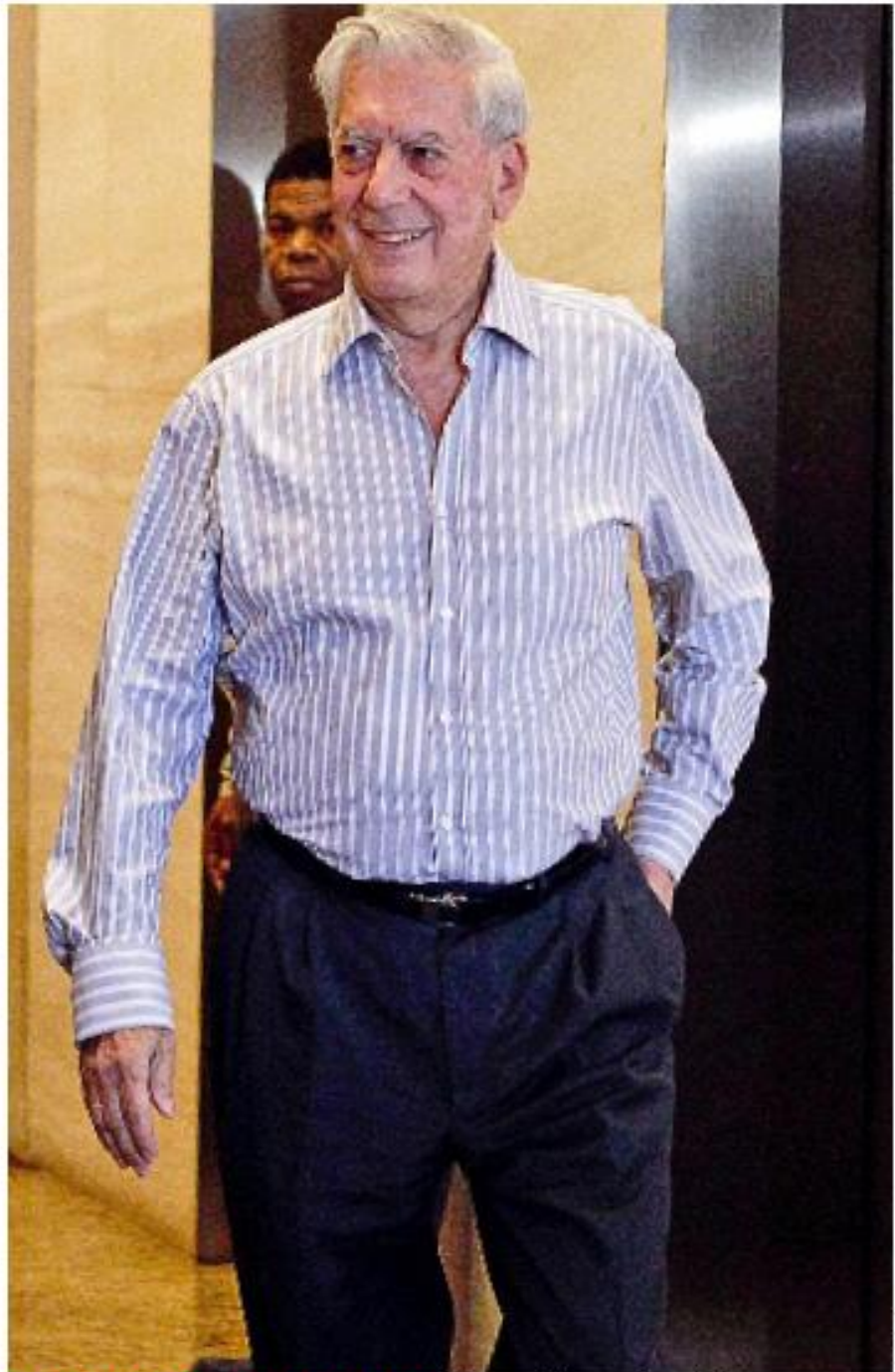
FLAMANTE GANADOR. Vargas Llosa saliendo de su estancia en Nueva York rumbo al Instituto Cervantes.

“Sus novelas son frescos humanos que incluyen la situación social y política, pero ahí sumerge personajes de carne y hueso, con todas sus virtudes y miserias”.