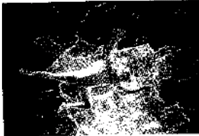
Fuerza Bruta, de La Guardia