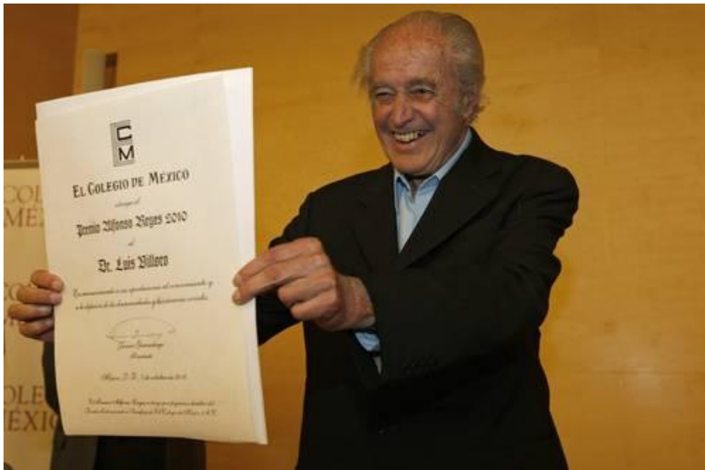
LUIS VILORO, AYER, EN EL AUDITORIO DEL COLMEX, DONDE RECIBIÓ EL PREMIO ALFONSO REYES.

Una democracia comunitaria eliminaría toda forma de exclusión de cualquier persona o grupo, asevera el académico