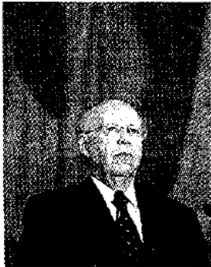
El rector de la UNAM