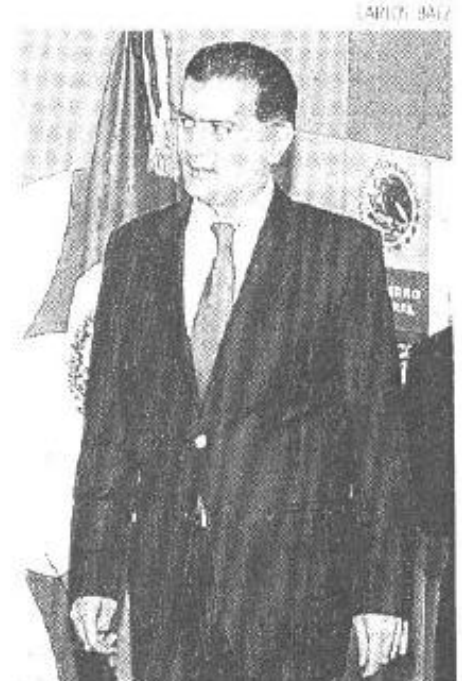
El titular de la SEP

Otros temas que se abordarán en la reunión, adelantó, es el que informe por qué se realizaron contrataciones con empresas extranjeras.