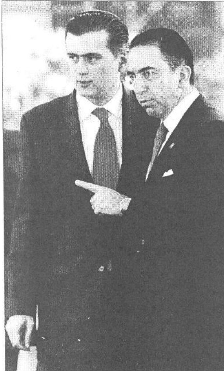
Los titulares de las secretarías de Educación Pública, Alonso Lujambio, y del Trabajo y Previsión Social, Javier Lozano, durante la inauguración de la Semana nacional por una cultura de la productividad en la escuela. El acto se llevó a cabo en instalaciones de la SEP en la ciudad de México