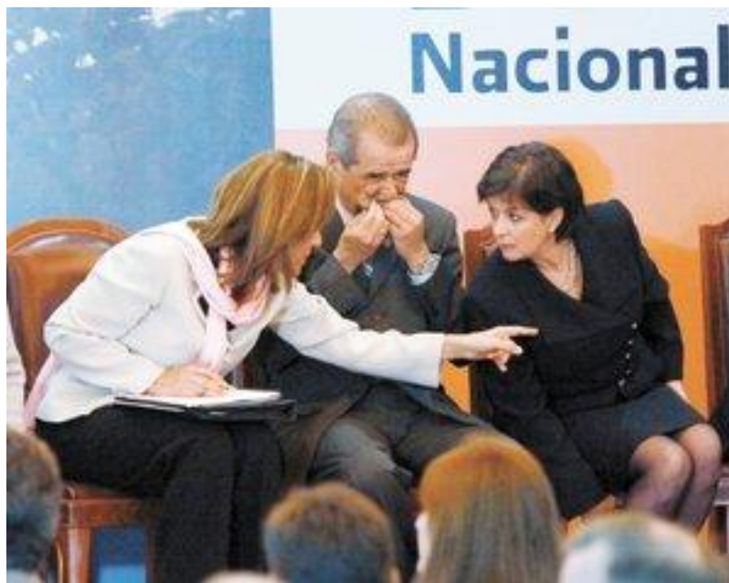
ENCUENTRO. MARGARITA ZAVALA, PRESIDENTA DEL DIF NACIONAL; JOSÉ ÁNGEL CÓRDOVA, SECRETARIO DE SALUD, Y CECILIA LANDERRECHE, TITULAR DEL DIF, DURANTE LA INAUGURACIÓN DE “LA SEMANA NACIONAL DEL MIGRANTE

Sin embargo, consideró que cada día nuestro país está mejor preparado. “Tenemos red de laboratorios; tenemos medicamentos; ahora una planta productora de vacunas, de tal forma que si llega H5N1 podremos reaccionar más sólida y más rápidamente”, enfatizó.