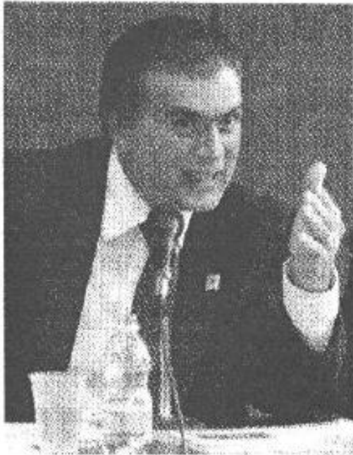
Lujambio compareció en San Lázaro