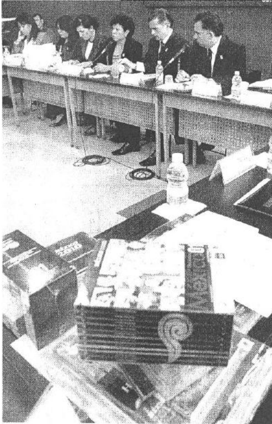
COMPARECENCIA . Diputados reclamaron al titular de la SEP que en los libros conmemorativos existen vacíos históricos