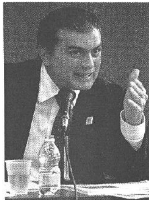
EL TITULAR de la SEP compareció ayer ante diputados.