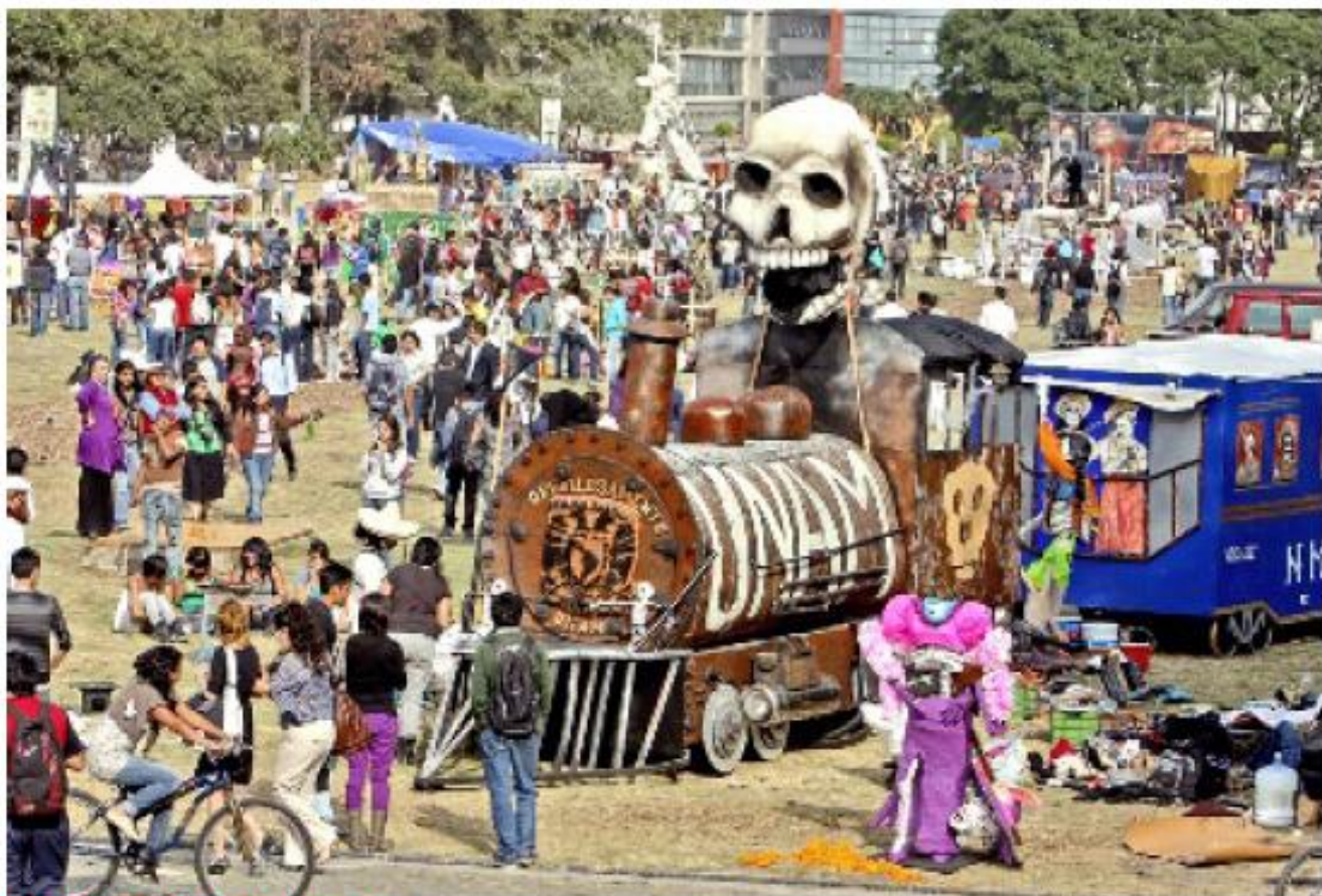
CAMPOSANTO PUMA. La Mega Ofrenda montada en Ciudad Universitaria se compone de 80 ofrendas que son exhibidas durante los siguientes cinco días.