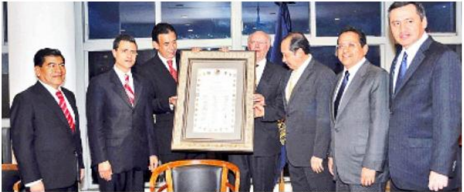
> El reconocimiento fue entregado por los gobernadores de la Comisión de Educación de la Conago.