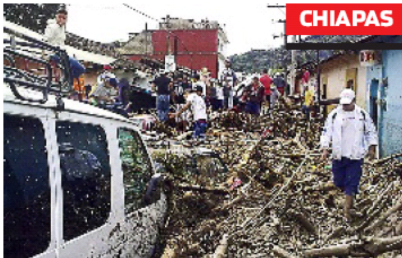
► Habitantes de Yajalón se agruparon para limpiar los escombros.

"Estamos en una situación peor a la contingencia de hace dos semanas. Ahora son escuelas derrumbadas, no hay agua potable, energía eléctrica, y se cayó un puente", señala el Edil.