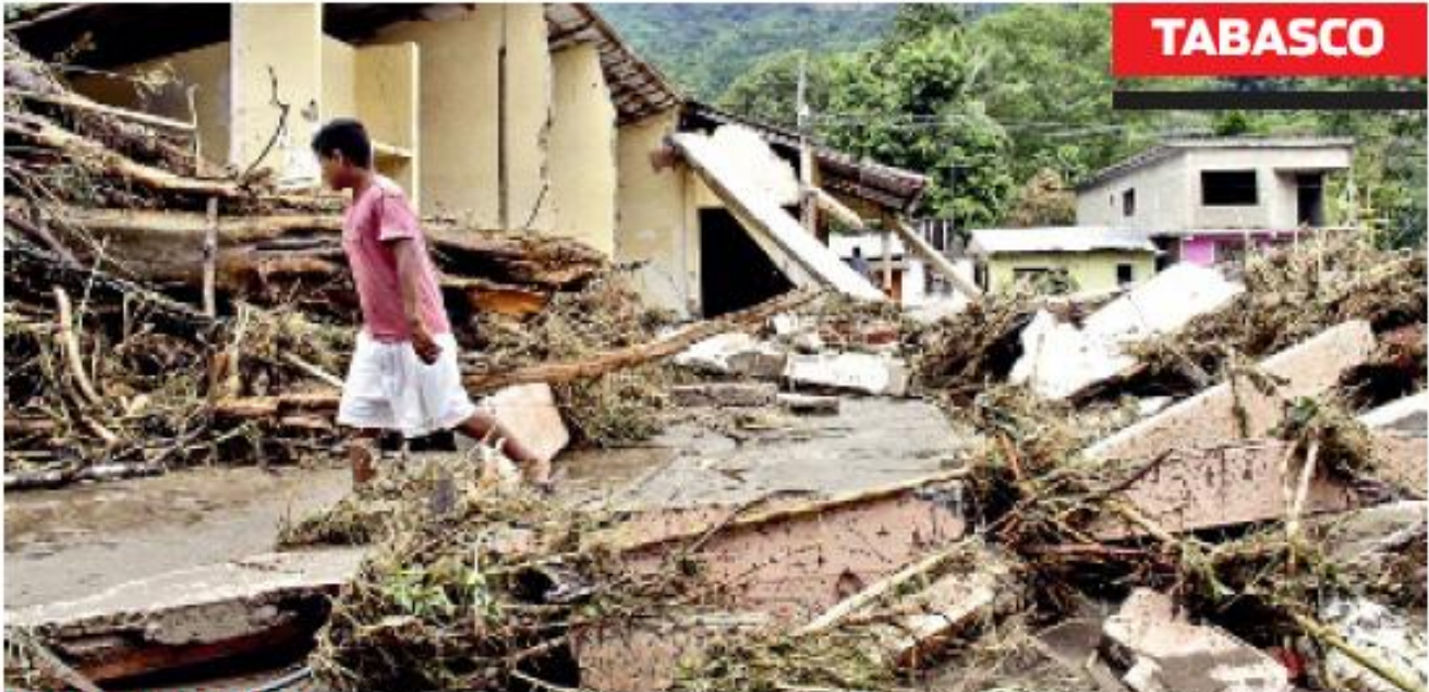
DEVASTACIÓN. Pobladores de Tacotalpa encontraron sus casas destruidas por el río Oxolotán.