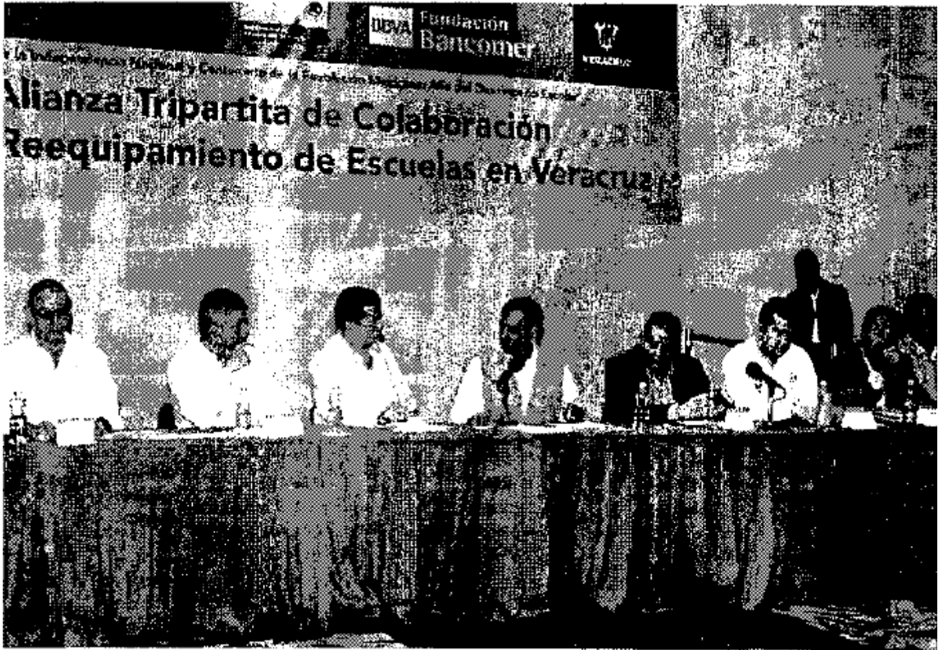
El mandatario (centro) subrayó que su gobierno, la SEP y el Grupo BBVA Bancomer aportarán siete mmdp para atender los inmuebles afectados.