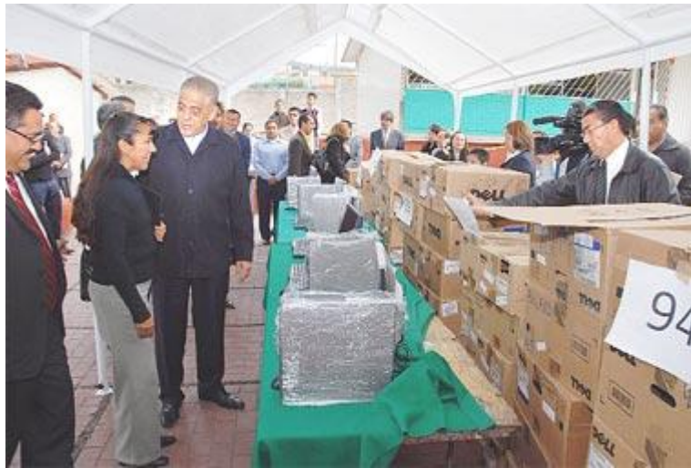
EL ALCALDE DE TLALNEPANTLA, ARTURO UGALDE MENESES, EN LA ESCUELA PRIMARIA MIGUEL N. LIRA