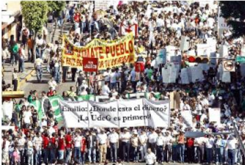
> Los inconformes mostraron pancartas de protesta contra el Gobernador de Jalisco, Emilio González.