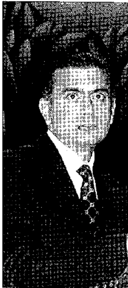
Alonso Lujambio, titular de la SEP.

Fue una comparecencia que por momentos se tornó rispida entre el funcionario y los diputados sobre todo del PRI y PT a tal grado que Lujambio hasta