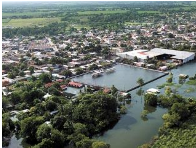
KARL, MATTHEW Y EL DESFOGUE DE PRESAS MANTIENEN INUNDADA A TLACOTALPAN

Estudiantes universitarios becados por el Programa Nacional de Becas y personal de la Secretaría de Educación y Cultura de Veracruz se manifestaron en Xalapa, capital del estado, por el incumplimiento del gobierno local en pagos de becas y prestaciones.