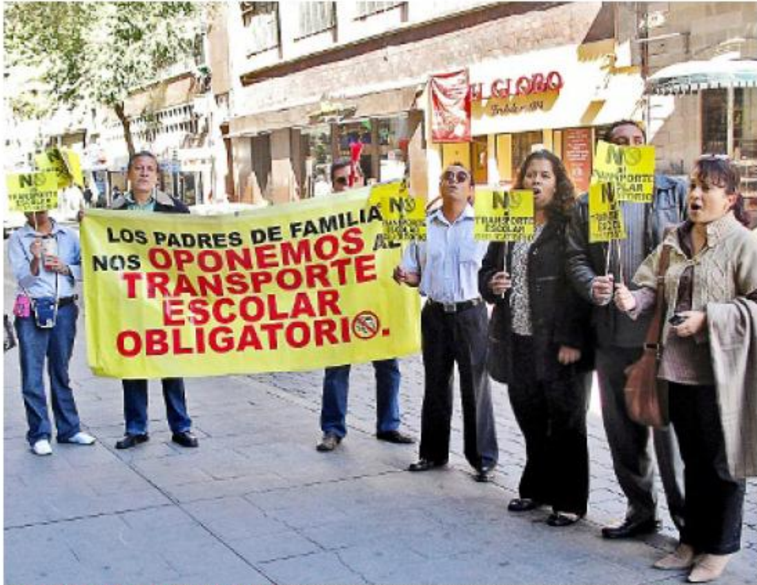
ENSEÑAN DESCONTENTO. Padres de familia que participaron en un foro organizado en la Asamblea para discutir sobre el Transporte Escolar obligatorio reiteraron su rechazo al programa del GDF.

de diciembre modificar la Ley Ambiental del DF para invalidar el decreto emitido por el Jefe de Gobierno, Marcelo Ebrard.