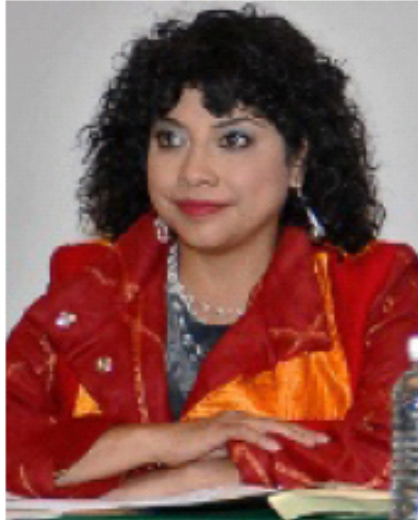
> La titular de Iztapalapa, Clara Brugada compareció en la ALDF.