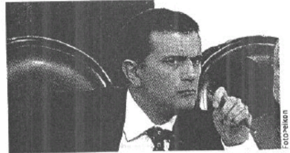
EL SECRETARIO, ayer en comparecencia.

“QUÉ NERVIOSO”, responde irónico al priista Romero, quien le cuestionó su interés en el 2012; Beatriz Paredes critica el proyecto de presupuesto para educación, que baja 0.3%.