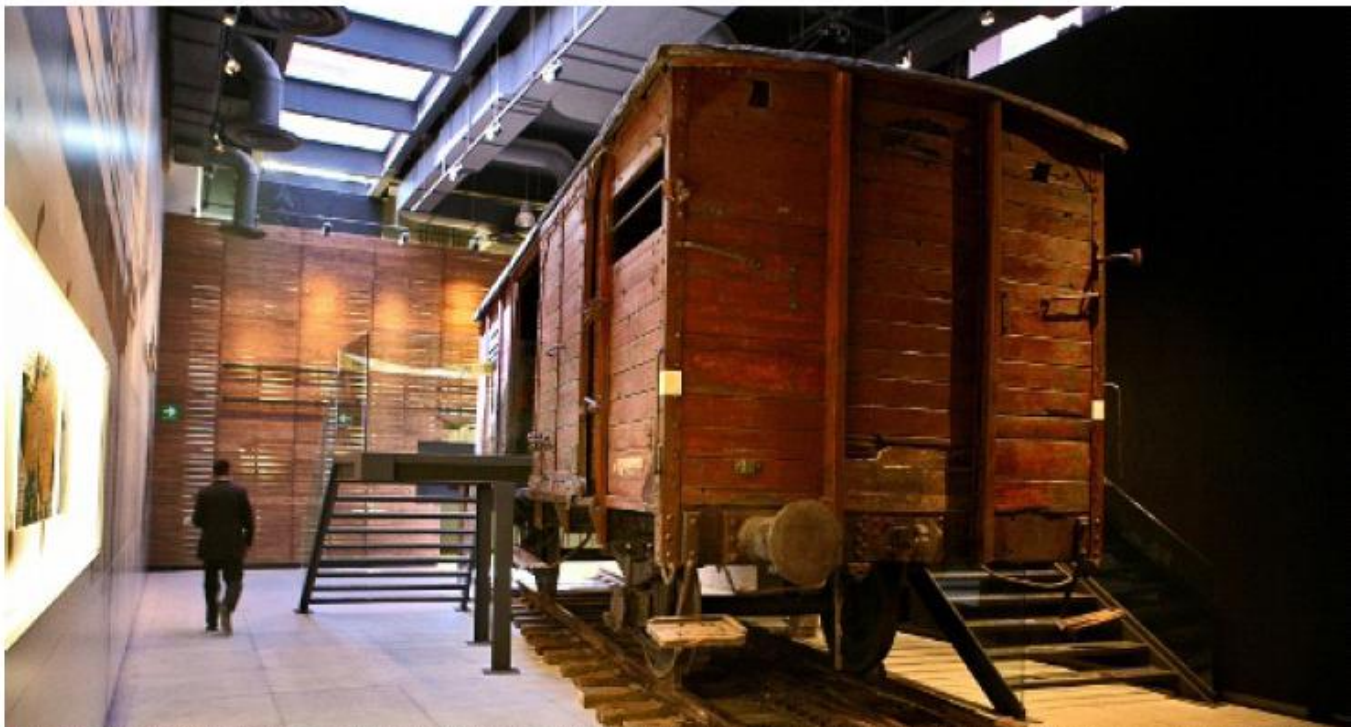
> Donado por el gobierno polaco, se exhibe en el quinto piso del museo un vagón de tren utilizado para el traslado de judíos a campos de exterminio.

Inauguran recinto en Plaza Juárez el 18 de octubre