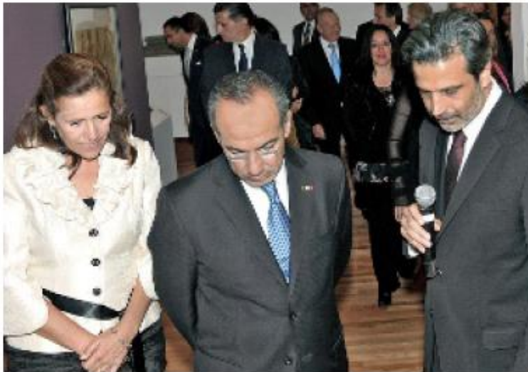
Felipe Calderón e invitados realizaron un recorrido por la exposición.

El 23 de septiembre de 1935 fue conformada como empresa en México, y desde su fundación ha producido 7 millones de vehículos, 20 millones de motores, 4 millones de transmisiones y 1.5 millones de toneladas de fundición