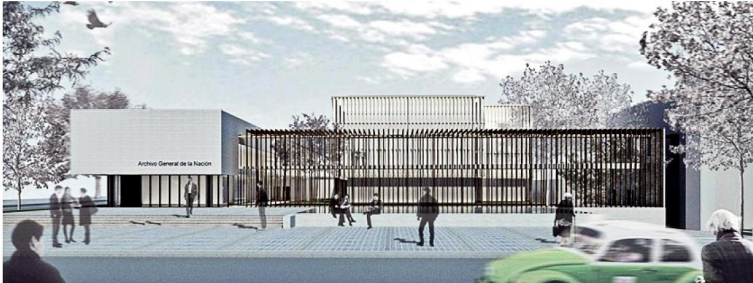
► El predio en el que se construirá la nueva sede del AGN cuenta con 8 mil metros cuadrados de superficie, mientras que el de Conafrut media unos 7 mil metros cuadrados.