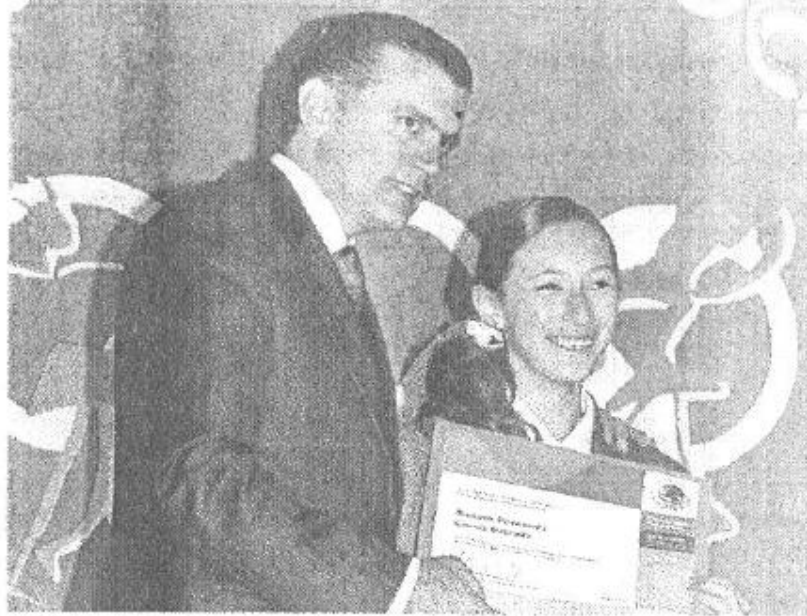
La SEP recibió a los niños de la "Generación del Bicentenario", ganadores de la Olimpiada del Conocimiento Infantil 2009-2010 y organizó para ellos la Semana de Convivencia Cultural en la ciudad de México.