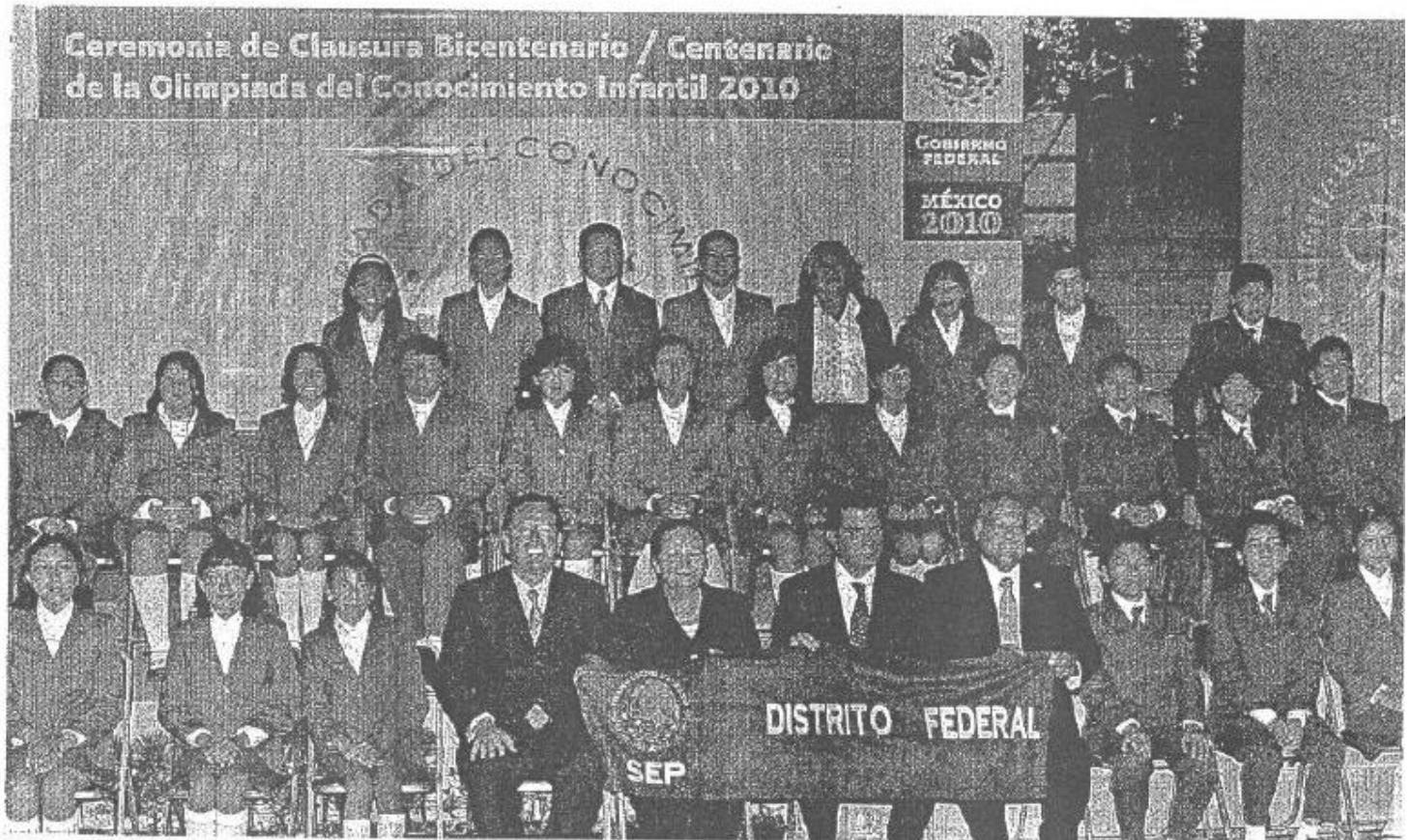
Niños y niñas ganadores de la Olimpiada del Conocimiento Infantil del Bicentenario 2010, se comprometieron a seguir trabajando para superarse y aprovechar al máximo la oportunidad que les brinda Fundación BBVA Bicosomer.