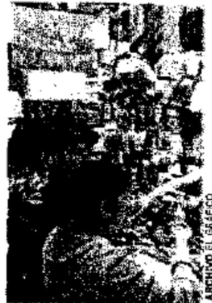
La Secretaría afirmó que no serán caros ni excesivos

A cuatro semanas de que se inicie el ciclo escolar 2010-2011, la SEP emitió en su página de internet www.sep.gob.mx/work/apps/site/lista_de_utiles/lista_utiles.pdf el listado de útiles y materiales que deberán adquirir los padres de familia que vayan a inscribir a sus hijos en preescolar, primaria o secundaria.