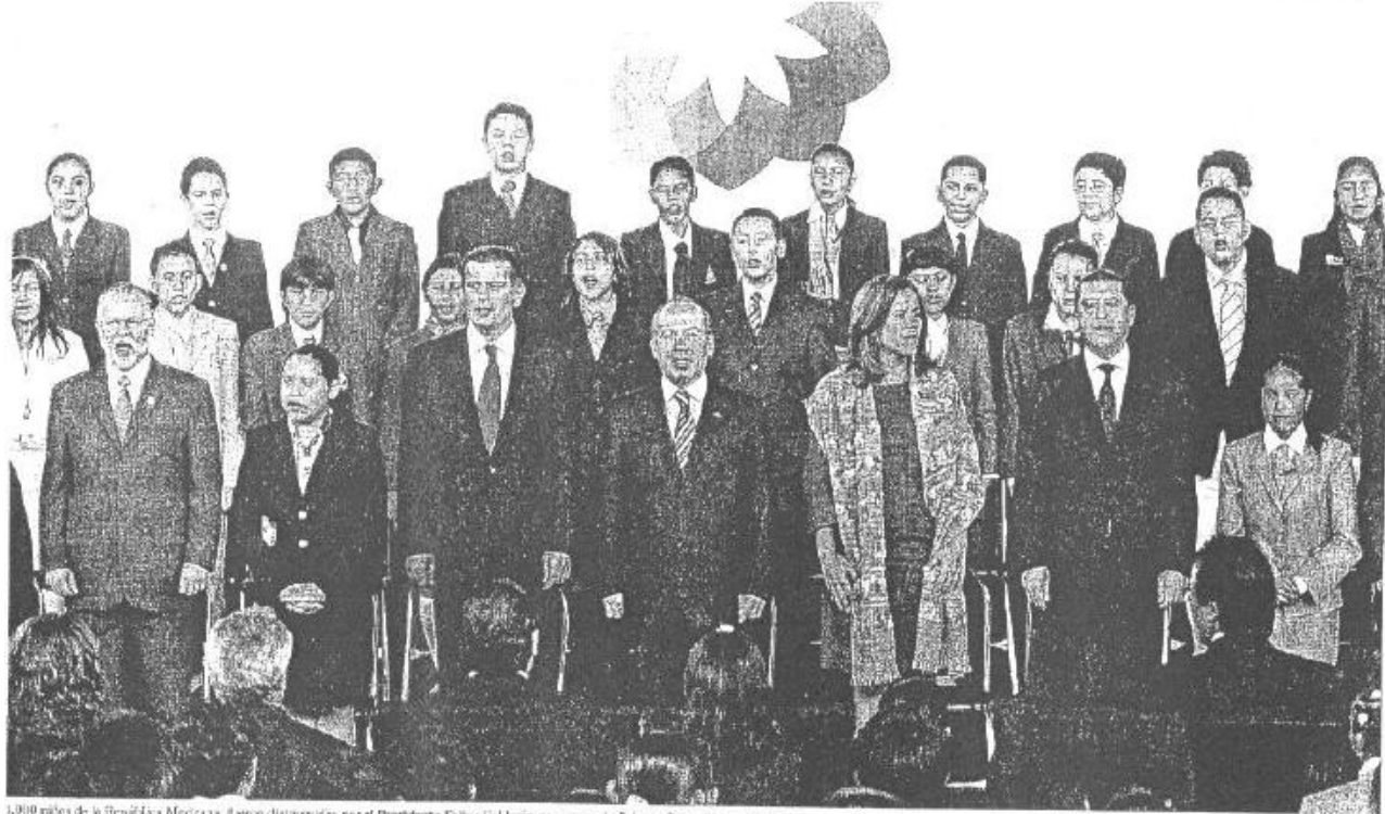
1.000 niños de la República Mexicana fueron distinguidos por el Presidente Felipe Calderón y se entregó la Primera Beca Margarita Zavala