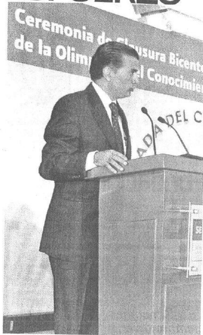
Alonso Lujambio Secretario de Educación Pública ofreció emotiva ceremonia de clausura para los ganadores de la Olimpiada.

El proceso de selección de los alumnos ganadores, en el que participan docentes y autoridades educativas federales y estatales de todo el país, se lleva a cabo en 3 etapas: por zona; por región, sector, jefatura de zona de supervisión o equivalente y finalmente por cada entidad. Las becas se rigen por el convenio y reglas de operación acordadas entre la SEP y la Fundación Bancomer, así como por decisiones de un Comité Técnico, integrado por funcionarios de ambas instituciones.