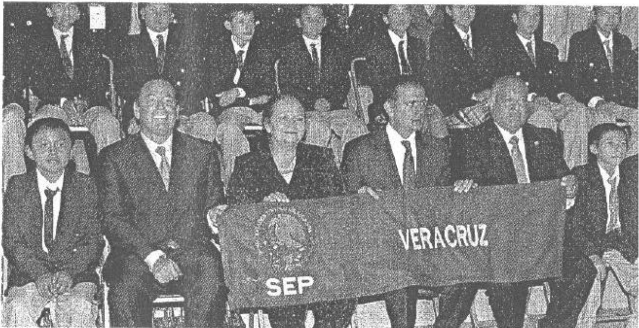
Fundación BBVA Bancomer se sumó al proyecto de la Olimpiada del Conocimiento, en el 2002, becando a 550 ganadores. A partir de la edición 2007 se incrementaron las becas de 550 a 1,000 becas en colaboración con la SEP