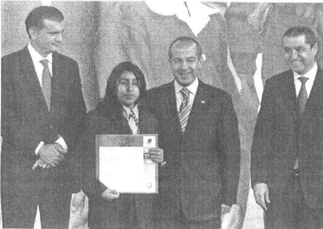
Aloso Lujambio, Secretario de Educación Pública, encabezó con el Primer Mandatario Felipe Calderón y el Presidente de BBVA Bancomer Ignacio Deschamps, la ceremonia de entrega de becas