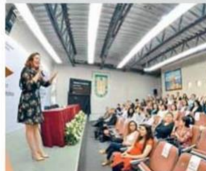
Se planea realizar una gaceta nacional.

Durante la asamblea se propuso la creación de una gaceta nacional; se determinó que la Red trabajará en las comisiones de Capacitación, Organización de Encuentros, Vinculación, Catálogo y Estadísticas de la Red; y se compartieron dos propuestas de sede para los próximos encuentros en Ciudad del Carmen, Campeche, del 23 al 26 de noviembre de 2017, y en Aguascalientes, en agosto o septiembre de 2018.