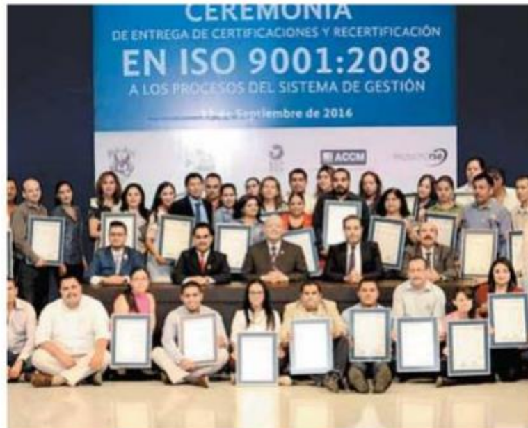
La universidad cuenta con 43 procesos certificados en la norma ISO 9001:2008 y y dos procesos en ISO 14001:2004.