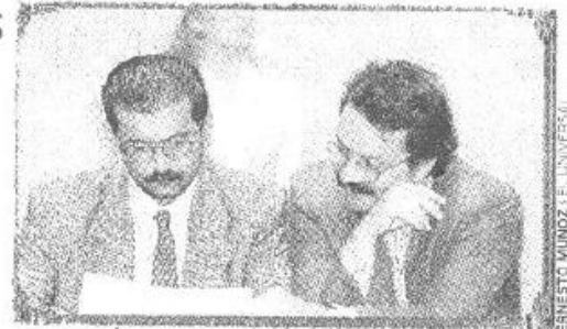
ERNESTO MUNDOZ Y EL UNIVERSAL

Digamos que fue en oferta de agosto, al 2x1 los legisladores de oposición le recriminaron algunos de sus actos.