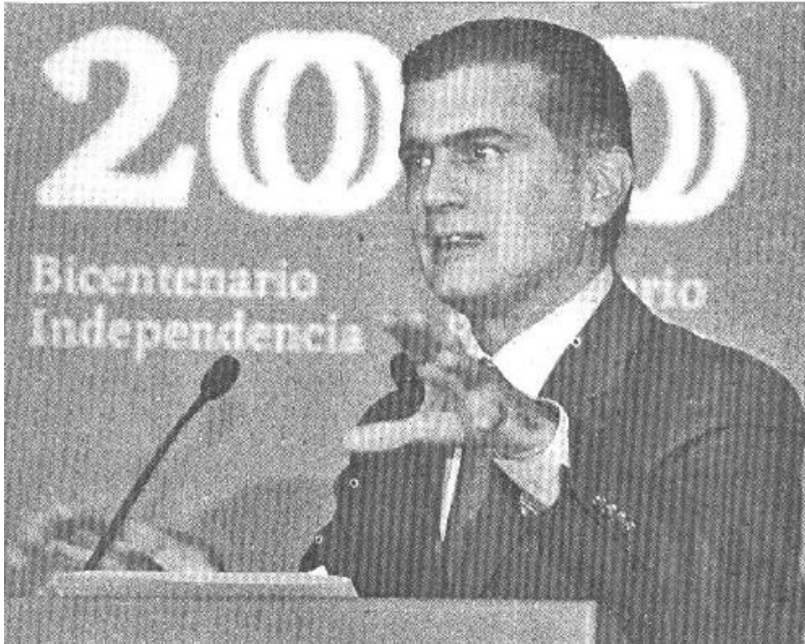
» ALONSO LUJAMBIO, titular de la SEP.