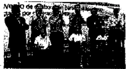
Los miembros del presidium reciben una entrega simbólica de cinco módulos, con el que serán reequipados 120 escuelas de estados de los tres países al convenio tripartita de colaboración, entre la SEP, el estado de Coahuila y la Fundación BBVA Bancomer.