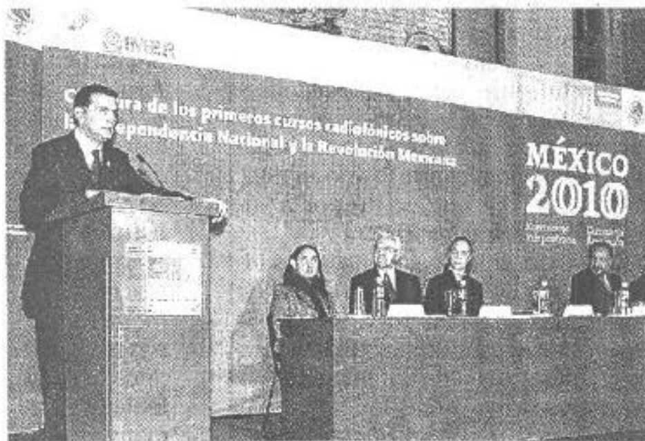
ELIJAÑERO clausuró los cursos radiofónicos del IMER.