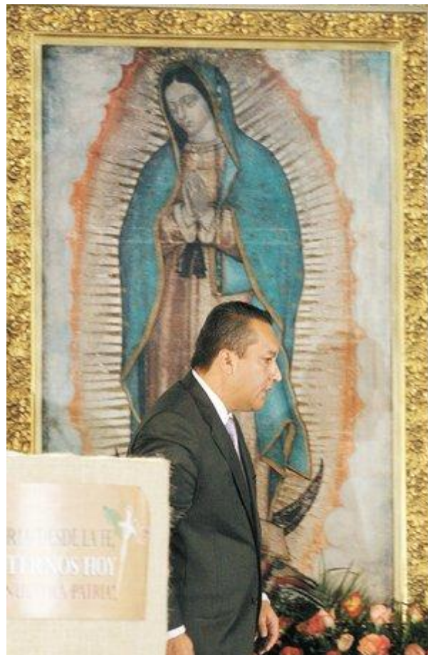
LAICIDAD. FRANCISCO BLAKE MORA, SECRETARIO DE GOBERNACIÓN

Blake insistió en que es necesario frenar el deterioro moral de nuestra sociedad, la cual si renuncia a su humanidad, renuncia a su futuro.