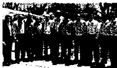
Ignacio Deschamps, ex-Lic. vicepresidente de Funcionarios y comercio electrónico de Bancomer, reconoció de que su institución apoya al sector educativo de Coahuila y Nuevo León.

Explicó que durante las primeras horas del desastre, BBVA Bancomer anunció un Plan de Apoyo para las zonas afectadas con un donativo equivalente a 1 millón de euros (500,000 euros de BBVA y 500,000 euros de Bancomer) (equivalente de 16 millones de pesos) para ayudar en la recuperación de los estados.