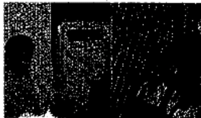
En la escuela, se usó una placa blanca e la suma de recursos para el reequipamiento del plantel con la colaboración de los tres niveles del Gobierno y de Hewlett Packard, que se sumó a la iniciativa.

de representantes sindicales y a los maestros y padres de familia, por el gran esfuerzo y trabajo que permitió recuperar la infraestructura educativa dañada por el huracán "Alex".