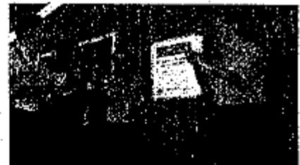
Los firmantes del convenio de colaboración en Coahuila desfilan una placa que dice: "No hay fuerza que pueda contra la voluntad de seguir adelante, una escuela de reequipada después del paso de huracán "Alex". Gracias a la suma de recursos..."

Deschamps agradeció a los Gobernadores Rodrigo Medina y Humberto Moreira, el interés y participación en este proyecto tripartita con la SEP y la Fundación Bancomer, que permitirá recuperar la infraestructura educativa que resultó dañada por las lluvias. También reconoció la labor de los dirigentes sindicales, maestros y padres de familia, en esta importante labor.