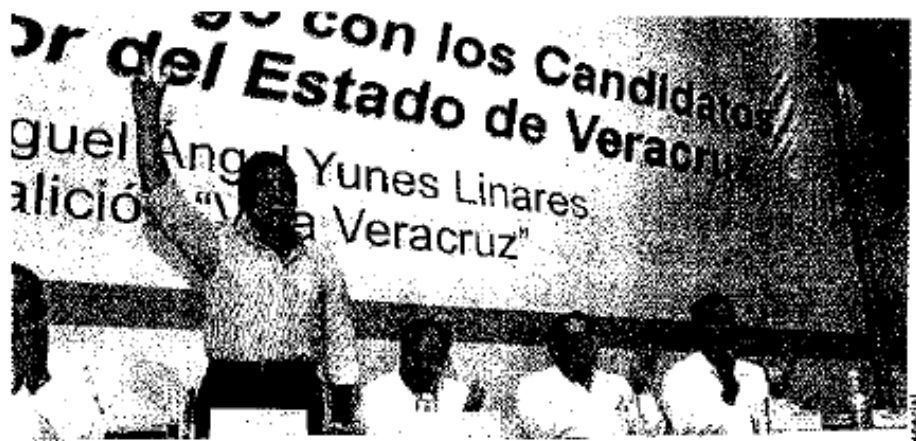
EL ASPIRANTE se reunió con las secciones 32 y 56 del SNTE.

EL CANDIDATO de la alianza Viva Veracruz ofreció la titularidad de la dependencia estatal al mejor docente del estado