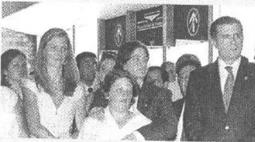
El titular de la SEP, Alonso Lujambio (derecha) será el encargado de anunciar la puesta en marcha de los consejos escolares.