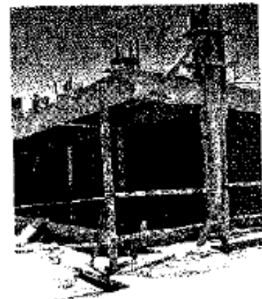
Los recursos de las escuelas públicas deberán ser informados.

Los Lineamientos establecen que los Consejos Escolares darán a conocer a las madres y los padres de familia el monto de recursos que recibe la escuela a través de programas federales, estatales y locales, tales como Escuelas de Calidad, Escuela Se-