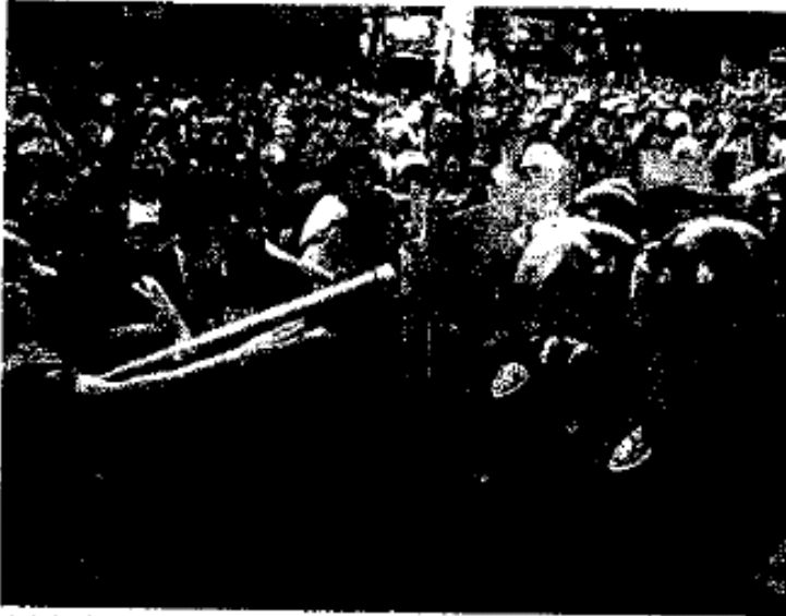
JUEVES DE CORPUS. Manifestantes y policías chocan.