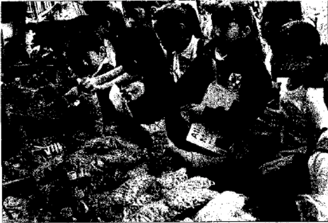
Problemática. En las escuelas primarias, la mayoría de los productos que se expenden son dulces, botanas y refrescos.