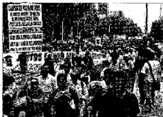
» INTEGRANTES del Sindicato Mexicano de Electricistas y del Comité del 68 marcharon por avenida Insurgentes.