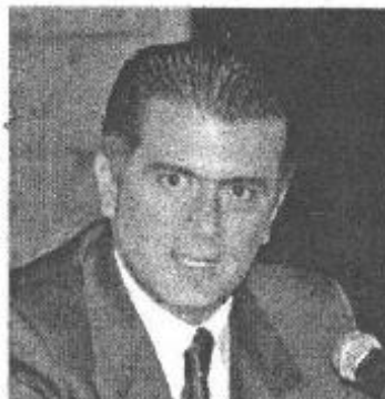
ALONSO LUJAMBIO IRAZÁBAL, Secretario de Educación Pública

“ Mi absoluto apoyo y entusiasmo, porque creo que historias de éxito, la construcción del imaginario colectivo a partir de nociones constructivas, positivas de nuestra vida colectiva puede ayudarnos. Subrayar lo que nos une, lo que nos fortalece, lo que nos hace exitosos, contribuye a fortalecer el espíritu colectivo, el ánimo de la nación y el optimismo social; yo creo que es una iniciativa muy constructiva, muy positiva que yo aplaudo. Sé muy bonitas historias, en el sistema educativo, ver a una madre indígena de 22 años recibir su certificado de alfabetización, leer en público y decir leyendo que gracias al curso que ha tomado, es una historia que creo que Iniciativa México debiera conocer. Es muy sencilla, es muy humilde, pero es un cambio radical que se produce para esa familia. ”