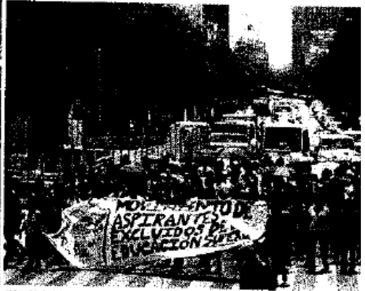
EXCLUIDOS. Jóvenes demandan más lugares.