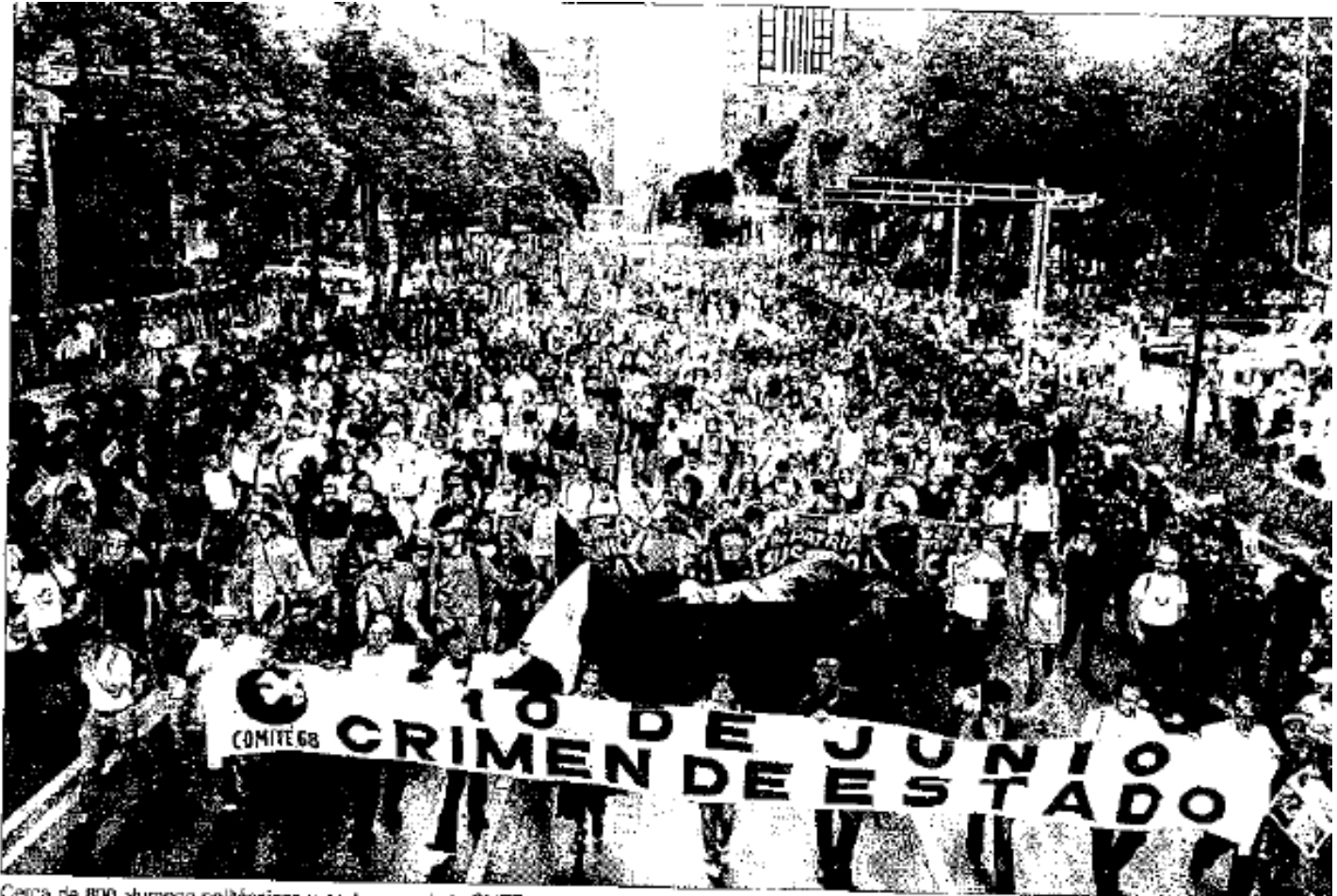
Cerca de 800 alumnos politécnicos y profesores de la CNTE participaron en la marcha, cuya descubierta fue encabezada por miembros del Comité 68. Antes, hubo un mitin ante las instalaciones de Canal 11