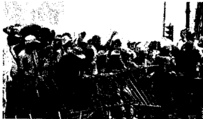
SIME. Derriban una reja para ser escuchados por la Corte.

LAS PROTESTAS INICIARON durante la mañana y duraron hasta casi las 20:00 horas, cuando se dispersaron los quejosos