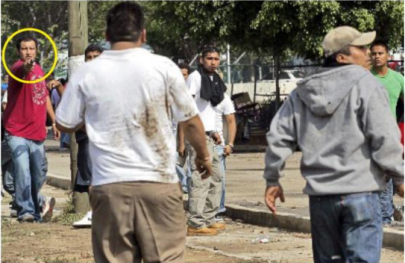
ENCAÑONADOS. Presuntos estudiantes arribaron al plantel armados con pistolas, palos y piedras.