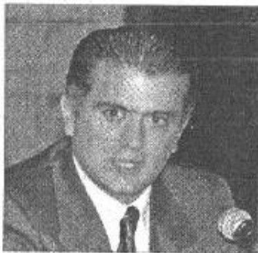
ALONSO LUJAMBIO IRAZÁBAL, Secretario de Educación Pública

Mi absoluto apoyo y entusiasmo, porque creo que historias de éxito, la construcción del imaginario colectivo a partir de nociones constructivas, positivas de nuestra vida colectiva puede ayudarnos. Subrayar lo que nos une, lo que nos fortalece, lo que nos hace exitosos, contribuye a fortalecer el espíritu colectivo, el ánimo de la nación y el optimismo social; yo creo que es una iniciativa muy constructiva, muy positiva que yo aplaudo. Sé muy bonitas historias en el sistema educativo, ver a una madre indígena de 22 años recibir su certificado de alfabetización, leer en público y decir leyendo que gracias al curso que ha tomado, es una historia que creo que Iniciativa México debiera conocer. Es muy sencilla, es muy humilde, pero es un cambio radical que se produce para esa familia.”