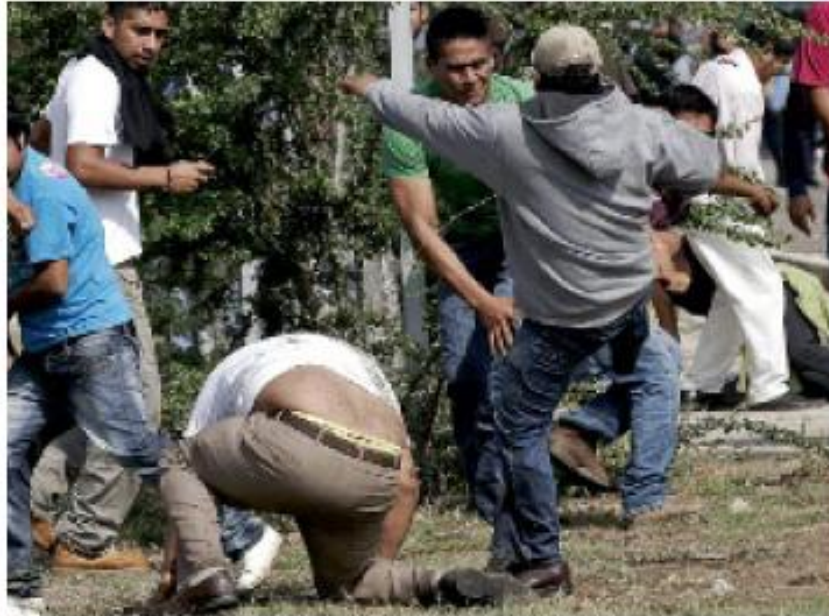
> El enfrentamiento en la facultad duró casi una hora.