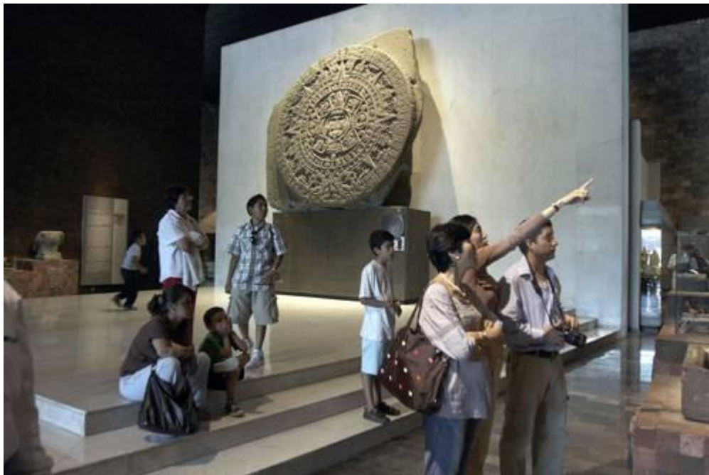
UNA DE LAS SALAS DEL MUSEO NACIONAL DE ANTROPOLOGÍA.