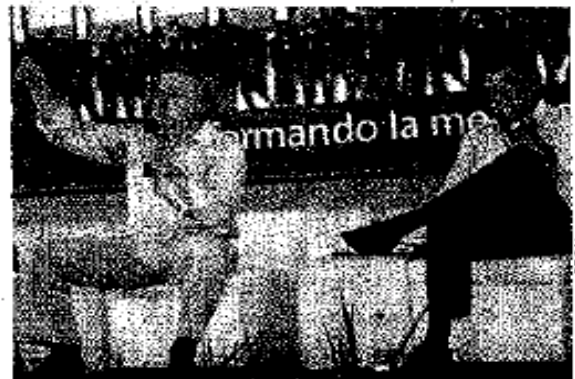
El tapado soy yo.