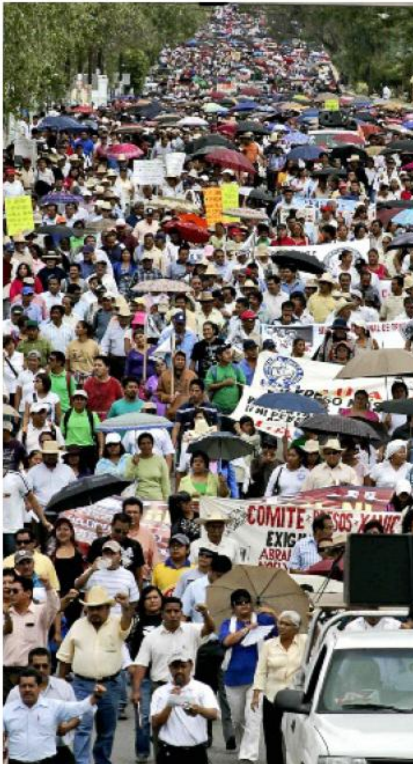
> De acuerdo con el magisterio fueron más de 500 mil los que tomaron las calles. Según las autoridades estatales no pasaron de 20 mil.