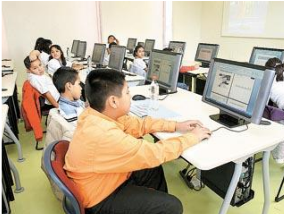
ESTE PLAN SE DESARROLLÓ CON UNA COLABORACIÓN MULTISECTORIAL.

El proyecto Red de Innovación y Aprendizaje, iniciativa que agrupa varios centros de capacitación impulsados por las tecnologías de información, se presenta como uno de los más importantes del país al alcanzar más de 50 mil usuarios y seis mil 400 graduados en sólo dos años