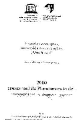
PRECISIÓN. Informe de la UNESCO, fechado en 2010