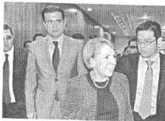
Alonso Lujambio y Georgina Kessel.

De ahí la importancia de construir una nueva refinería, la cual creará 40 mil empleos directos e indirectos durante las fases de ingeniería y construcción y más de 400 una vez en funciones. ☒