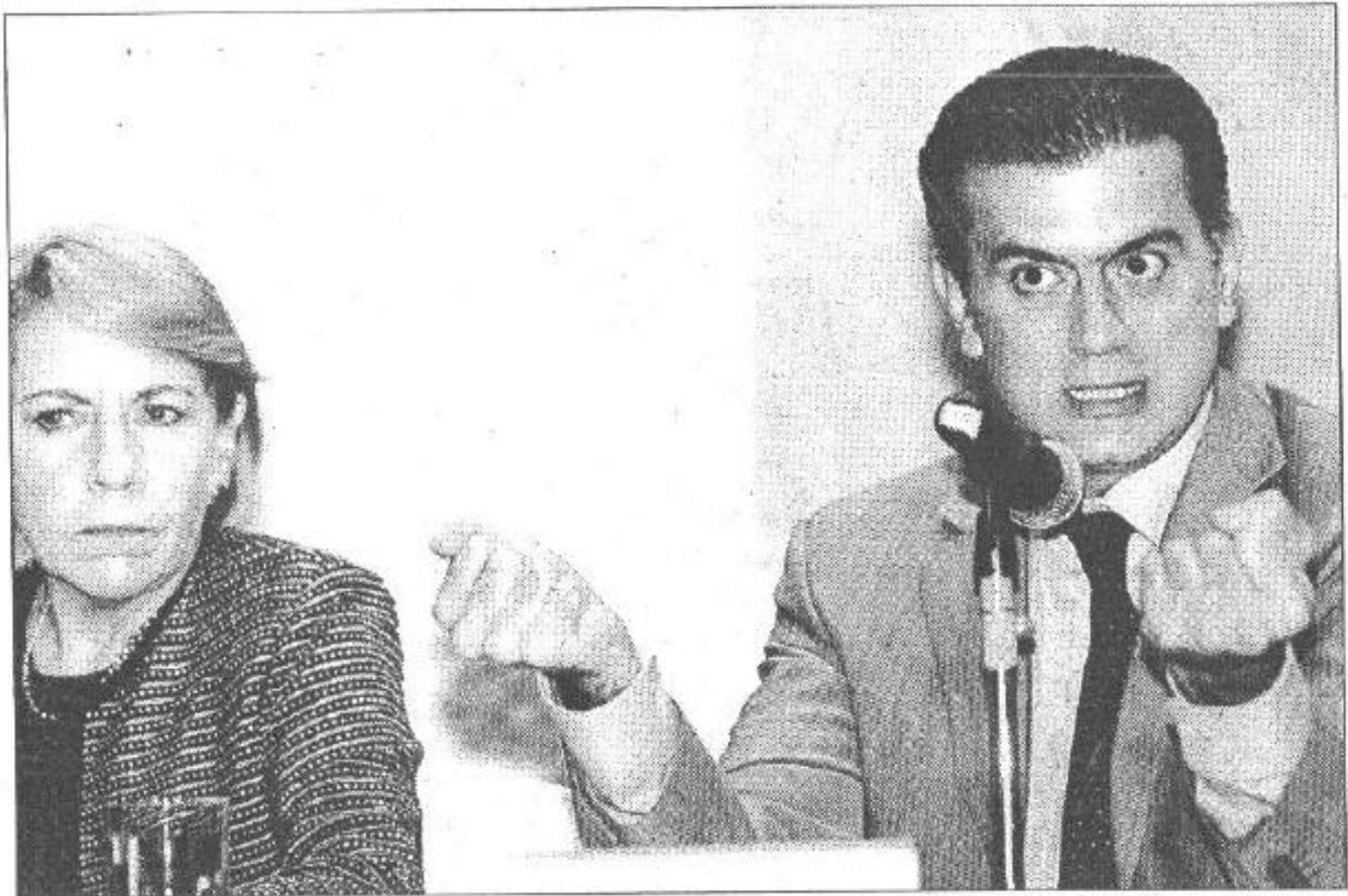
Alonso Lujambio, secretario de Educación Pública, y Georgina Kessel, titular de Energía, hablaron sobre la seguridad de una refinería que planea construir Pemex y del rescate de la zona arqueológica que se encuentra en Pachuca, donde se efectuó la conferencia de prensa