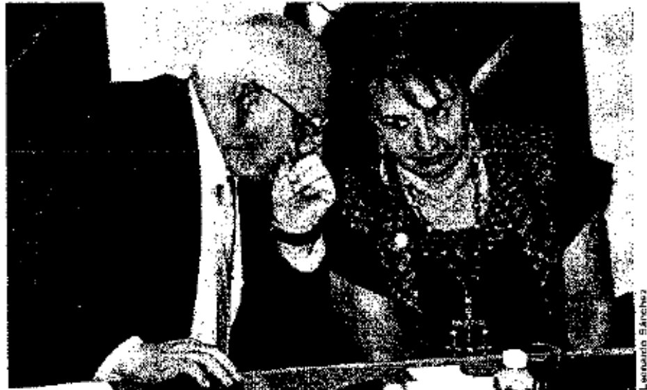
> Rodolfo Tuirán, subsecretario de Educación Superior, y Yoloxóchitl Bustamante, directora del IPN.

Alrededor de 21 por ciento de los estudiantes universitarios, agregó, han sufrido algún robo, asalto o agresión en la escuela o en su entorno cercano; cerca de 7 por ciento de las estudiantes han sido objeto de algún tipo de hostigamiento o agresión sexual en