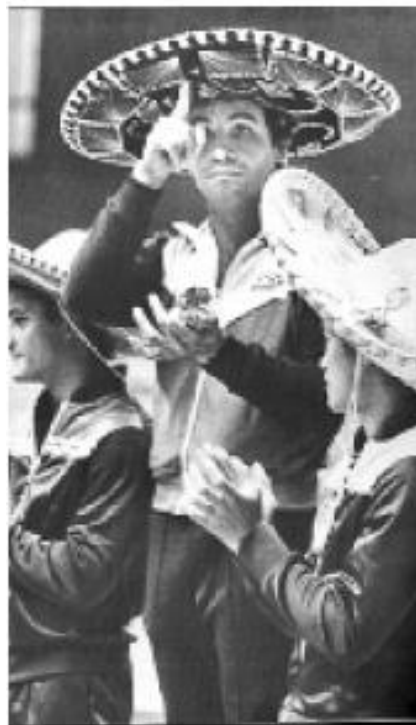
Brillo... Capilla aportó a los clavados tricolores casi la mitad de preseas olímpicas.

Capilla destacó también en Centroamericanos y Panamericanos, con cuatro títulos en cada una de esas justas.