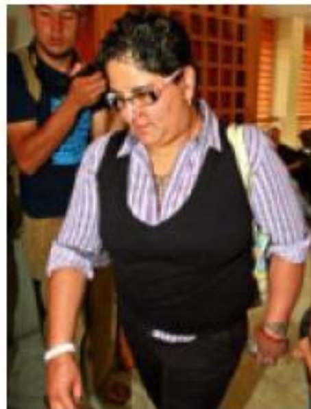
Duelo... La campeona en Sydney 2000, Soraya Jiménez lamentó el deceso.