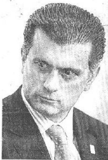
El titular de Educación Pública