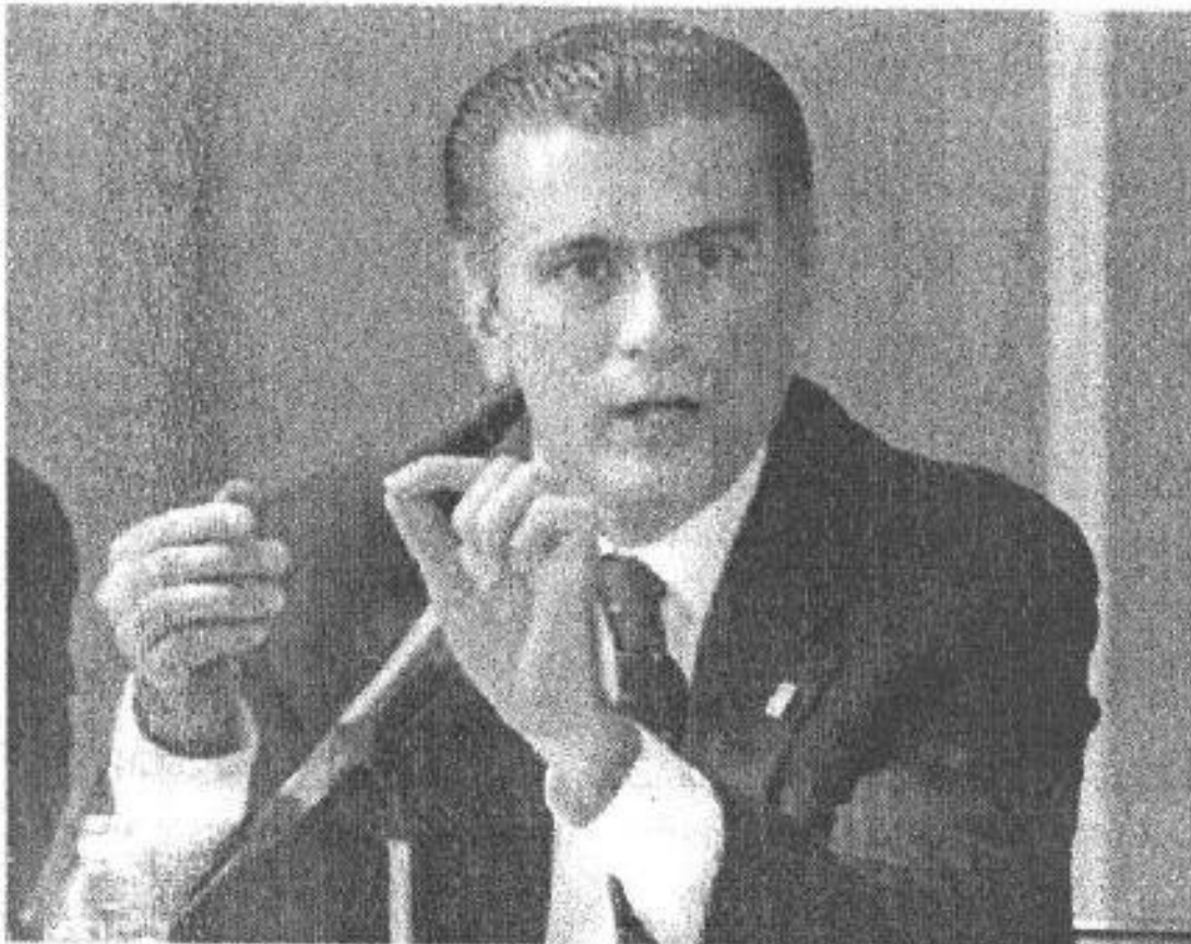
CLARO. El secretario aprueba la creación del padrón de docentes