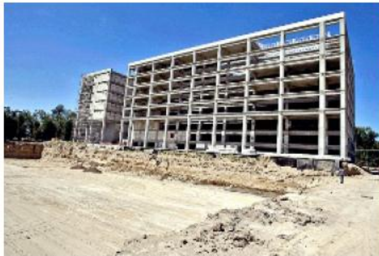
> Así lucía la obra constructiva de la Biblioteca al 17 de abril de este año.

> REFORMA dio cuenta el 11 de mayo de 2005 que el proyecto de Museotec había sido ganador.