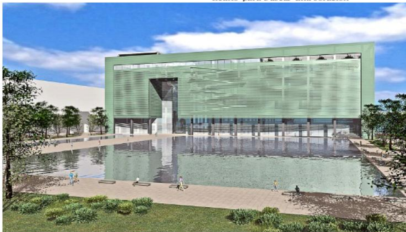
> El proyecto de Museotec comprende un edificio cúbico funcional, flexible con láminas de cobre en la fachada.

Fideicomiso de este centro, para preguntar por qué estaban utilizando un diseño diferente y argumentó que el nuestro era muy caro. ¿Cómo puede decir eso a estas alturas? Le propusimos modificarlo para buscar una solución