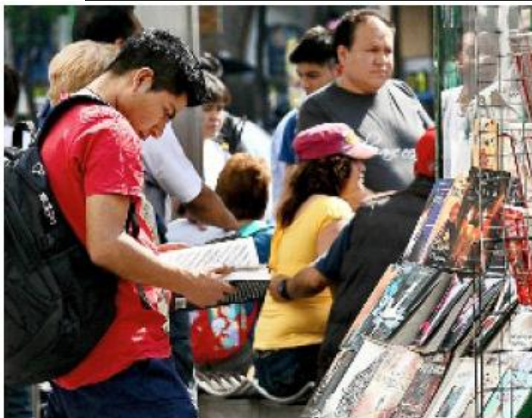
► Jaime se ahorró 100 pesos al comprar la versión apócrifa de “Luna Nueva”. Sólo pagó 120 pesos.

La Cámara Nacional de la Industria Editorial Mexicana (Caniem) calcula que de los 20 millones de libros que se venden en el País al año la mitad son “piratas” o fotocopiados.