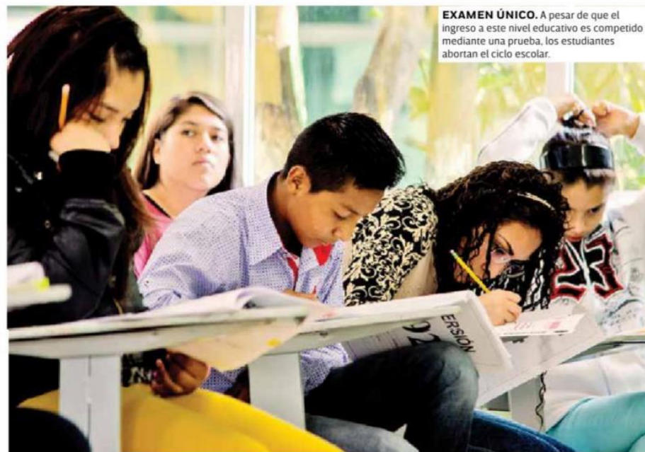
EXAMEN ÚNICO. A pesar de que el ingreso a este nivel educativo es competido mediante una prueba, los estudiantes abortan el ciclo escolar.

Ha venido disminuyendo lentamente, apenas en el ciclo 2011-2012 en la capital había una tasa de abandono de 21% y sigue muy alta, de 17%", detalló el subsecretario.