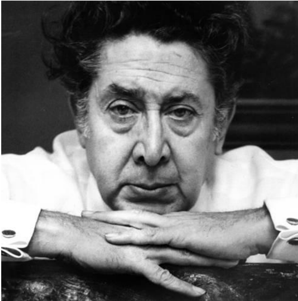
DAVID ALFARO SIQUEIROS. FOTO TOMADAS DEL LIBRO CHILE-MÉXICO: RESTAURACIÓN MURALES ESCUELA MÉXICO CHILLÁN