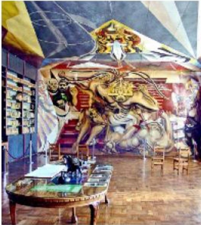
> “De México a Chile”, de Guerrero, se ubica en la recepción de la Escuela México de Chillán.