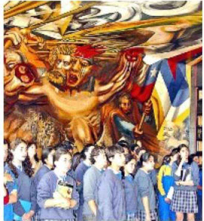
> “Muerte al invasor”, de Siqueiros, adorna la biblioteca. Fueron restaurados por el INBA en 2009.

que presente el edificio de la ONU, que recientemente entró en remodelación–, en un sitio aún no determinado. Una vez concluidos los trabajos, la pieza de 4 por 9 metros volverá a Nueva York.