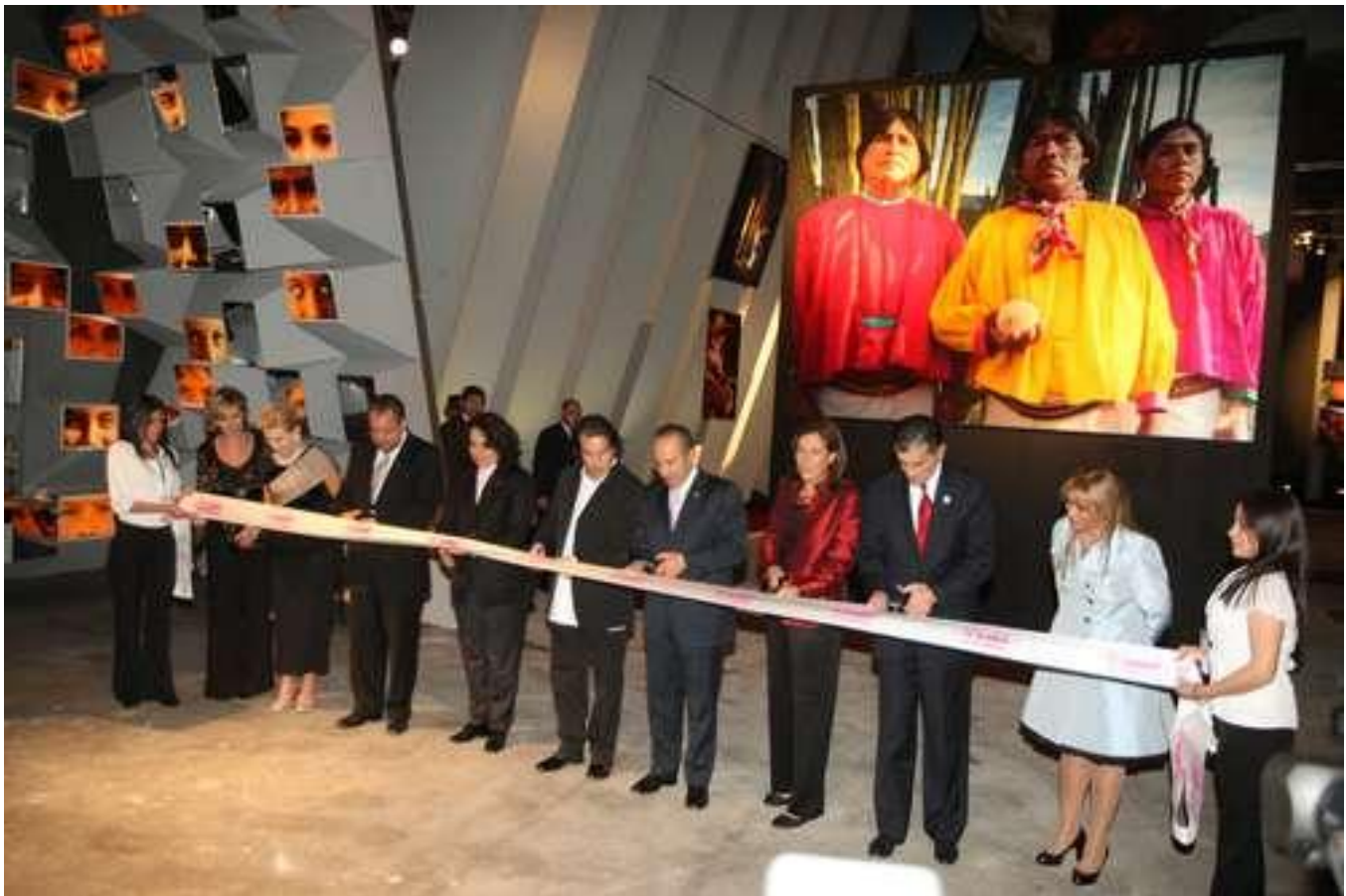
EL PRESIDENTE FELIPE CALDERÓN Y SU ESPOSA MARGARITA ZAVALA, AL CENTRO, LA NOCHE DEL MIÉRCOLES DURANTE LA INAUGURACIÓN DE LA EXPOSICIÓN MÉXICO EN TUS SENTIDOS , EN EL MUSEO ITINERANTE QUE SE INSTALÓ EN LA PLAZA DE LA CONSTITUCIÓN.