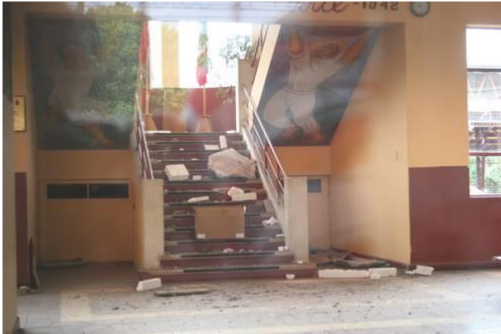
VISTA PARCIAL, AYER, DEL MURAL DAÑADO DE XAVIER GUERRERO.