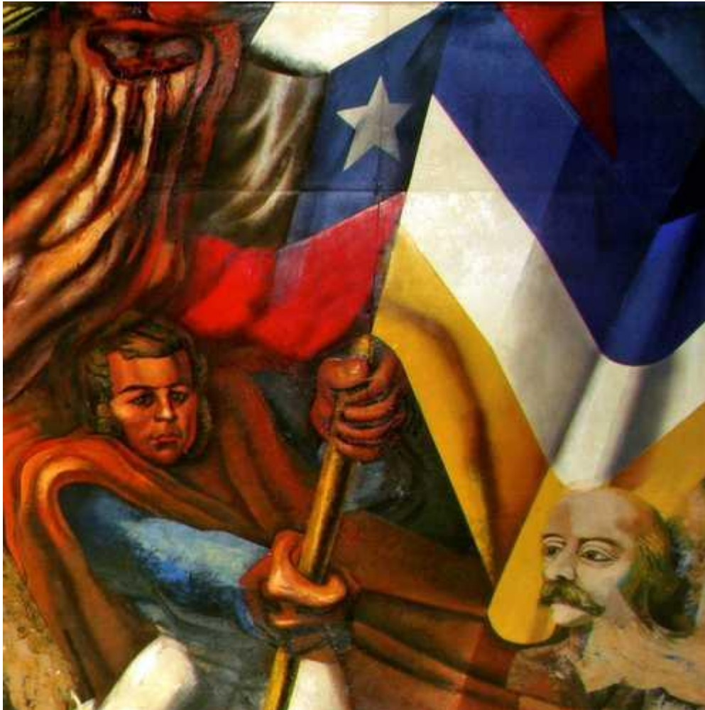
DETALLE DE SU OBRA MUERTE AL INVASOR .