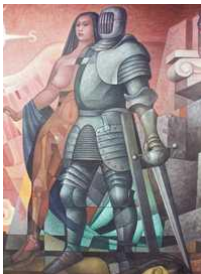
FRAGMENTO DEL MURAL PRESENCIA DE AMÉRICA LATINA , DE JORGE GONZÁLEZ CAMARENA. FOTO TOMADAS DEL LIBRO CHILE-MÉXICO: RESTAURACIÓN MURALES ESCUELA MÉXICO CHILLÁN

Muerte al invasor y De México a Chile fueron proyectos impulsados a propósito del terremoto que devastó Chillán en enero de 1939 y en el cual murieron en la zona 15 mil personas. El gobierno mexicano, encabezado por Lázaro Cárdenas, decidió entonces apoyar la construcción de una escuela.