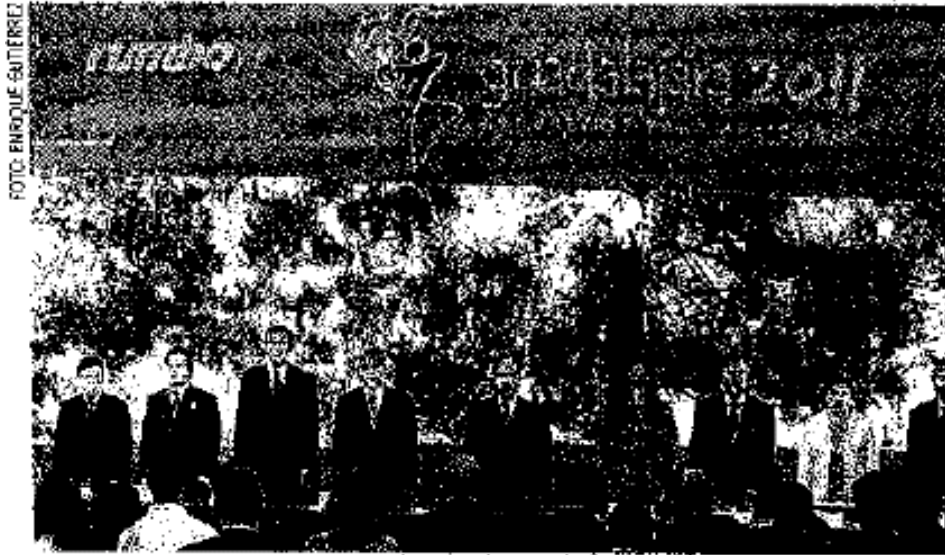
El miércoles pasado, miembros del Copag fueron recibidos por el Presidente