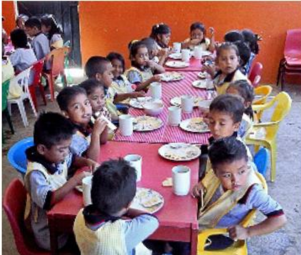
> El patronato inauguró ayer un comedor y un consultorio en la escuela de la colonia Frontera, en Acapulco.