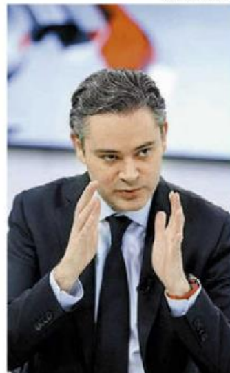
El titular de la SEP.