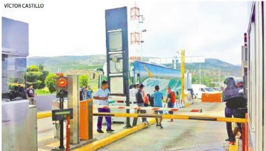
MÁS DE 40 estudiantes se concentraron en la Caseta de Peaje de Suchixtlahuaca