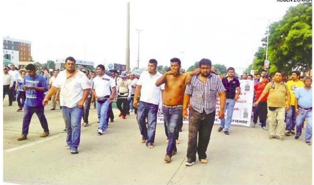
MAESTROS DETUVIERON a cinco personas infiltradas, encargadas de la quema de una camioneta y daños a otros vehículos

Esto provocó que los maestros de la CNTE-SNTE y Suicobach res-