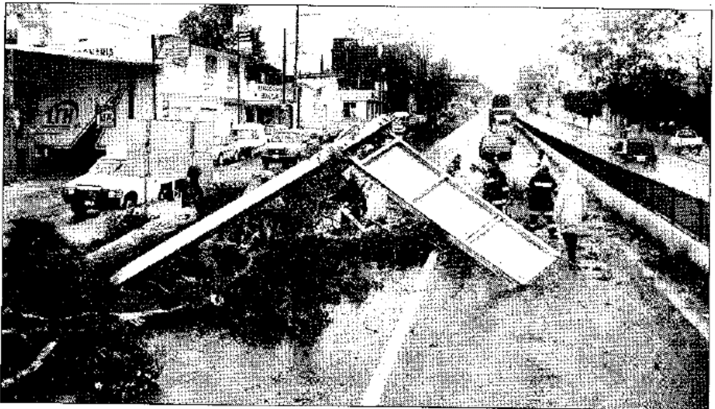
En Chilpancingo, Guerrero, las lluvias que han caído desde el miércoles provocaron desbordamientos e inundaciones y derribaron árboles, anuncios espectaculares y señalamientos de tránsito ■ Foto Óscar Alvarado

■ Inundaciones, desbordamientos, accidentes y deslaves en varios estados