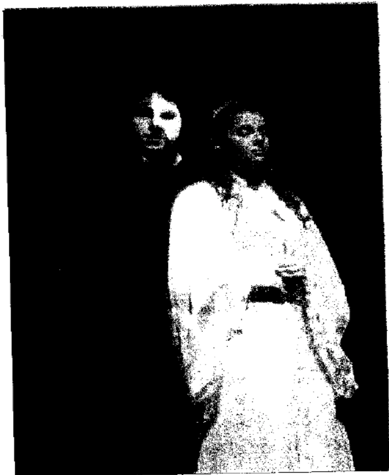
PUESTA. El proyecto será una oportunidad para conocer cómo se forman los cantantes de ópera.

El director general de Canal 22, Jorge Volpi, aseguró que el proyecto tiene como fin apoyar a los jóvenes cantantes de ópera mexicanos y lo-