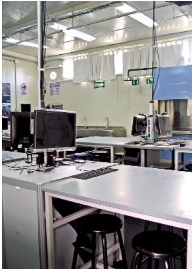
ASÍ, SÍ. El CCH ya cuenta con el prototipo de laboratorio de ciencias experimentales que sustituirá en todos sus planteles.

Con esta reforma, el CCH busca resolver problemas como los niveles de reprobación, elevar la eficiencia terminal que es de 54 por ciento y mejorar el desempeño de sus egresados en las licenciaturas, donde son rebasados por egresados de otros bachilleratos.