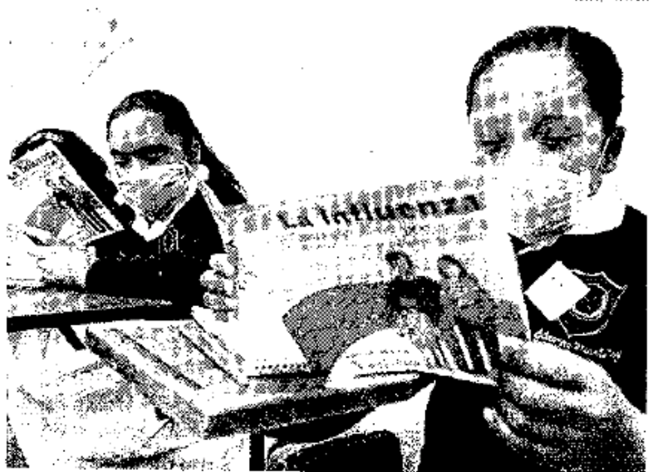
Sigue dando buenos resultados la campaña de vacunación en el DF

En esta ocasión regresaron a clases alrededor de 34 millones 300 mil alumnos, así como un millón 785 mil maestros en todo el país. La Comisión Nacional de Arbitraje Médico es la encargada