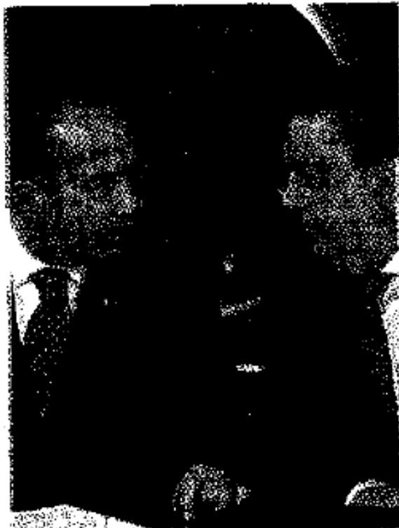
Felipe Calderón y Gómez Mont