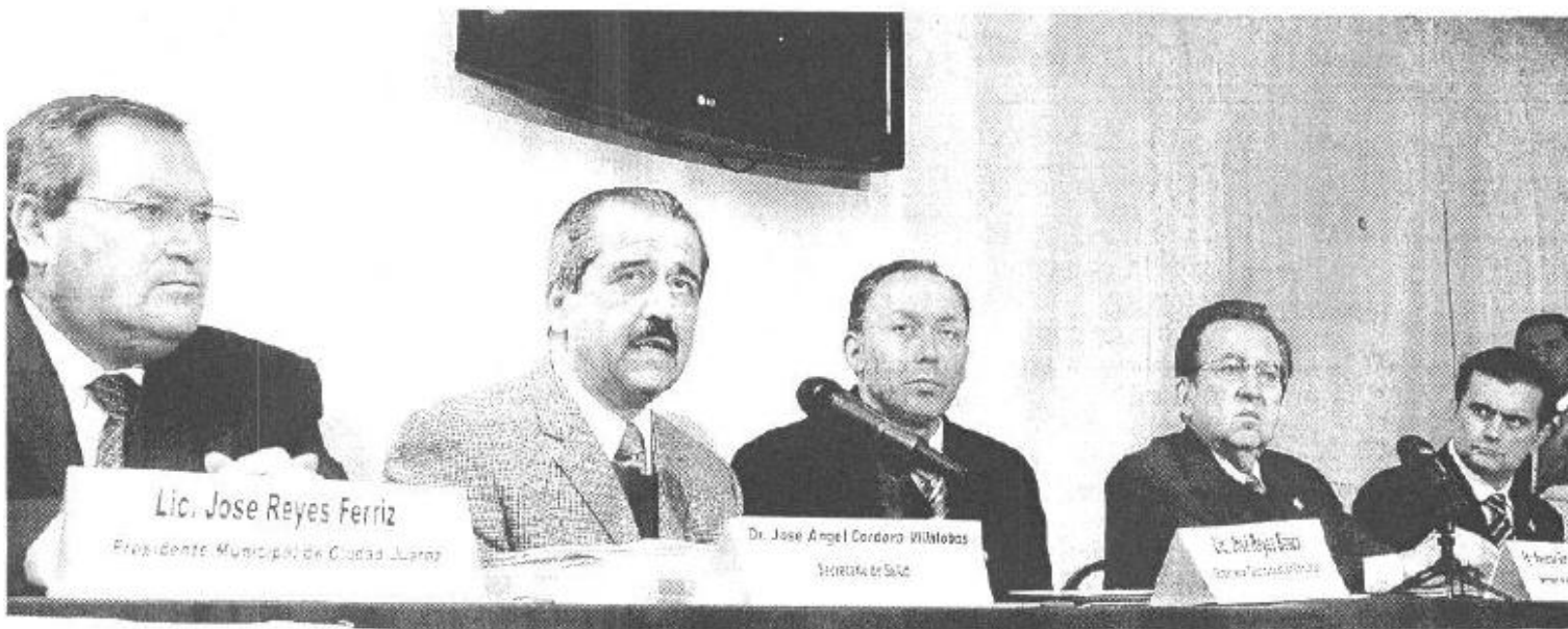
RECONSTRUCCIÓN. Funcionarios federales y estatales comenzaron las mesas de trabajo para reforzar el desarrollo de Juárez

500 agentes para que realicen trabajos de inteligencia y “desmantelen la estructura financiera de los cárteles”.