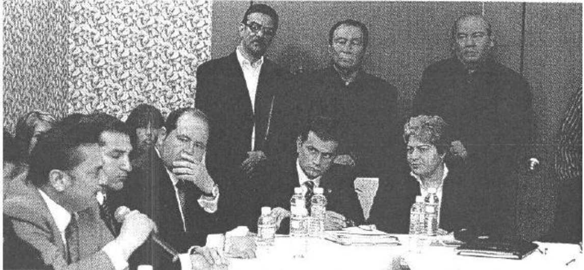
EL TITULAR de la SEP (sentado, seg. de der. a izq.) se reunió con representantes de organizaciones civiles

PARA EDUCACIÓN Superior se busca continuar con el apoyo a la ampliación de la Ciudad del Conocimiento de la Universidad Autónoma de Juárez.