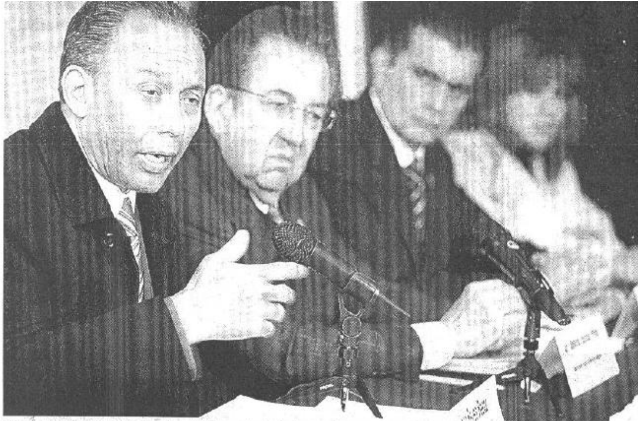
El gobernador Reyes Baeza y los titulares de la Reforma Agraria y de la SEP

Escuelas, clínicas y Seguro Popular, las prioridades