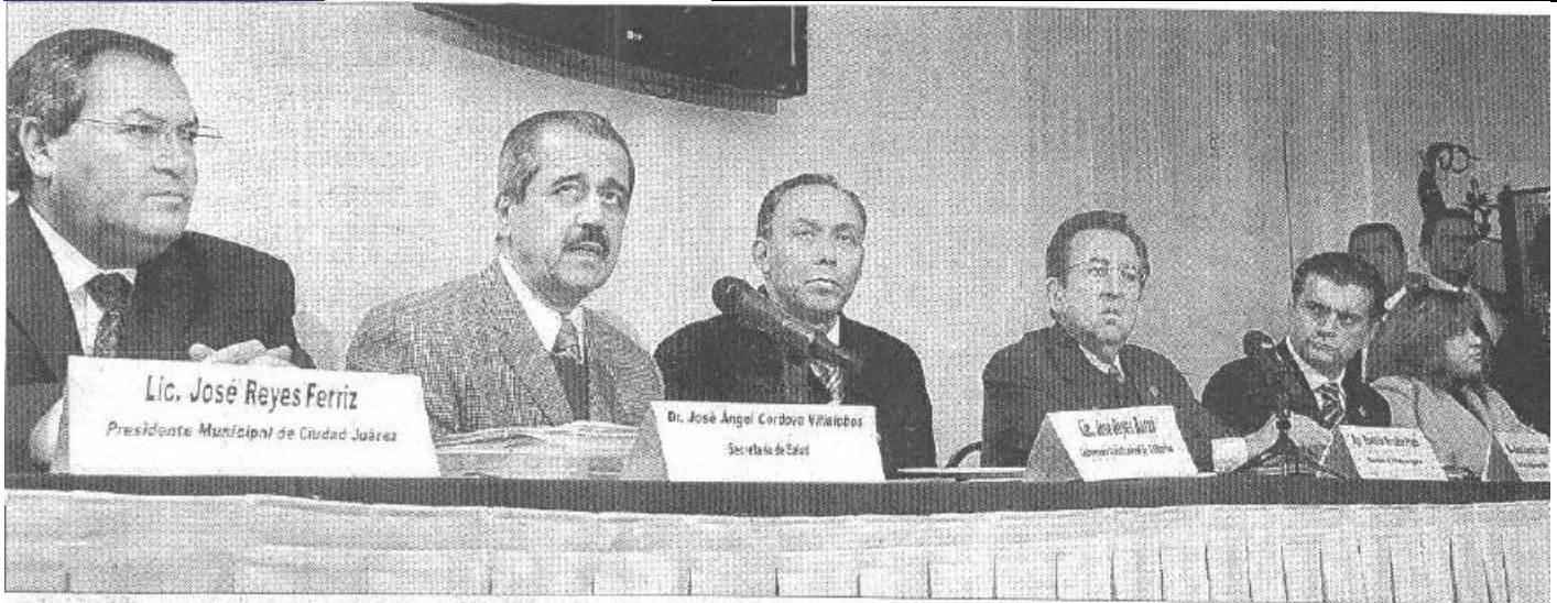
Estrategia: En las mesas de trabajo participaron autoridades estatales y secretarios de Estado.