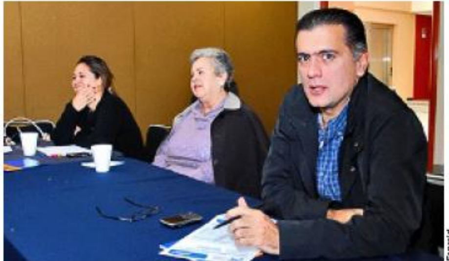
➤ Alonso Lujambio, titular de la SEP, durante su examen de admisión a las filas panistas, el 31 de octubre de 2009.

“Está en el proceso de darse de alta. Lo que falta es un paso. Tiene varios meses como miembro adherente. Ya tomó su curso, hizo su evaluación y lo único que