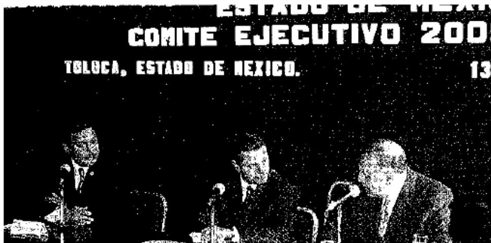
ENRIQUE PEÑA NIETO recibió al Comité Ejecutivo del SMSEM 2009-2010.

Me mantengo en la voluntad de lograr un acuerdo benéfico para los maestros”