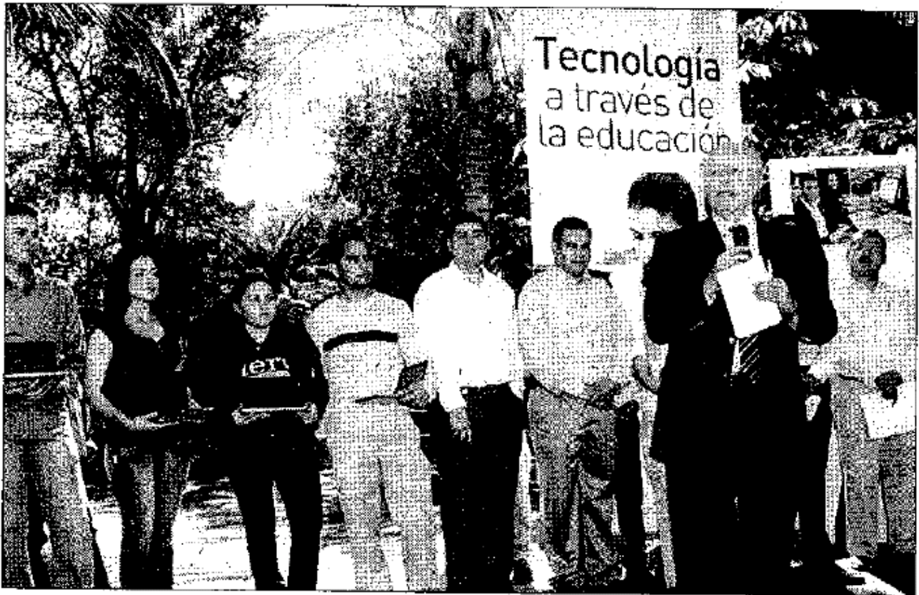
El rector de la Universidad Nacional, José Narro Robles, en gira de trabajo por Sinaloa, en la que la UNAM y la Universidad Autónoma de Sinaloa suscribieron cuatro convenios de colaboración