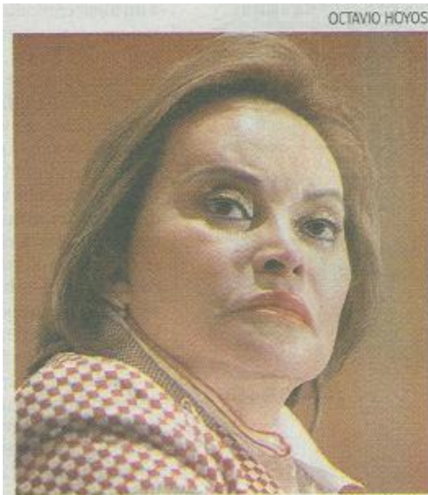
Elba Esther Gordillo