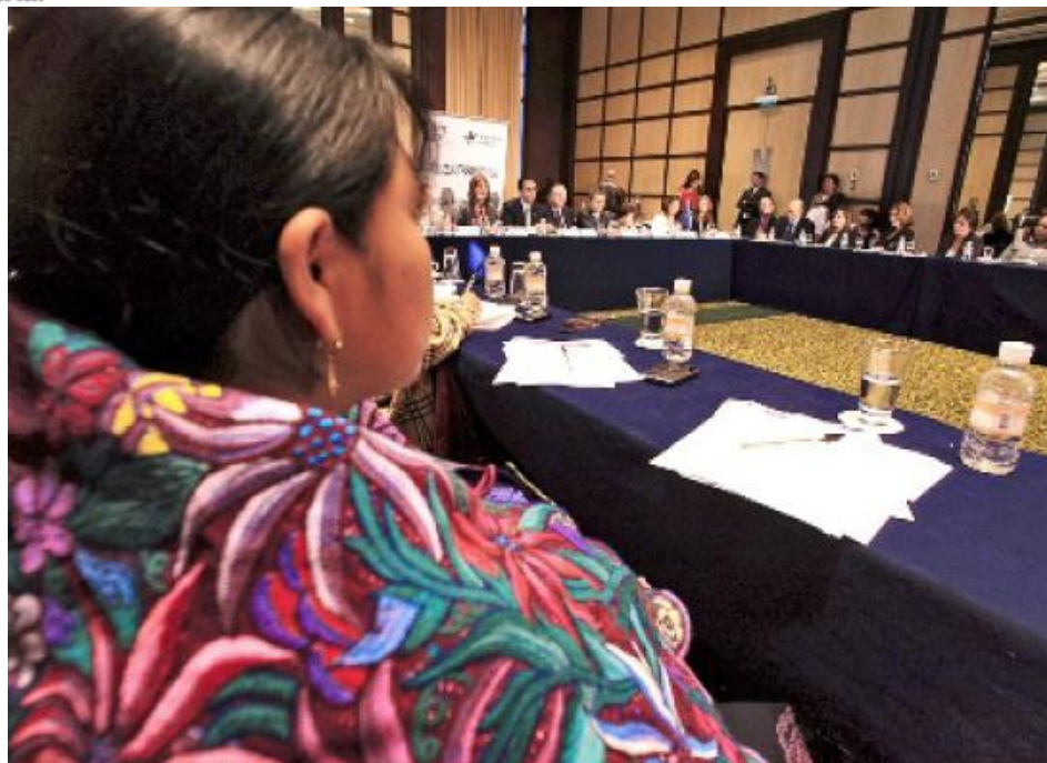
DERECHOS. La OIT presentó ayer el proyecto "Alto al trabajo infantil en la agricultura", el cual operará en Chiapas, Michoacán, Sinaloa y Veracruz.

3,250 se evitará que se incorporen al trabajo infantil.