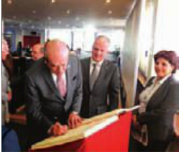
El acto fue organizado por el CICM.