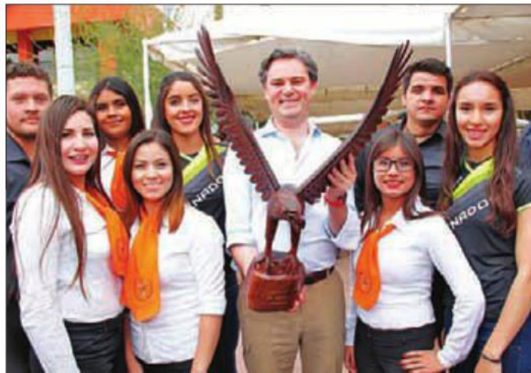
Aurelio Nuño entregó premios a los ganadores del certamen para la imagen institucional.

En la presentación de la imagen institucional del TecNM, en el estado de Sonora, en el Instituto Tecnológico de Hermosillo, el director general de TecNM, Manuel Quintero Quintero, informó que dicha institución forma al 47 por ciento de los ingenieros de todo el país, y contribuye con el 14 por ciento de la matrícula de educación superior, al tiempo que subrayó que de los diversos planteles han sali-