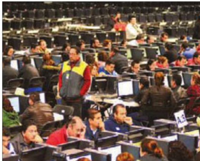
Los días 5, 6 y 7 de mayo pasados se realizó el Concurso de Oposición a cargos con funciones de Dirección, Supervisión y Asesoría Técnica Pedagógica en Educación Básica.

Entrevistado al término de la presentación de la imagen institucional del Tecnológico Nacional de México, el funcionario federal se refirió también a la negociación salarial que está en vigor con el Sindicato Nacional para los Trabajadores de la Educación (SNTE), y precisó que ya eso órgano de re-