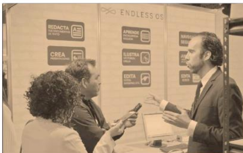
EL SO Endless destaca por su facilidad de uso, posee diversas herramientas y compatibilidad con funciones de cómputo y software.

Estas cifras muestran la brecha que existe entre los modelos de educación pública en México y las herramientas tecnológicas. Para combatir estos retos de conexión y de adopción de soluciones, Endless ha contribuido a través de diferentes iniciativas; por ejemplo con el reciente acuerdo firmado con la Fundación SINADEP, órgano de capacitación a maestros del Sindicato Nacional de Trabajadores de la Educación que consiste en un pro-