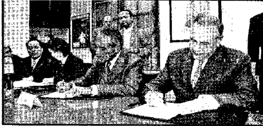
TOLUCA, Méx.- Representantes de la SEP y la ASE firmaron un acuerdo de cooperación.