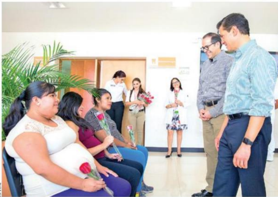
Día de las Madres. El mandatario destacó el apoyo a las mamás del país.

Otro de los beneficios explicó que a lo largo del país existen miles de guarderías del Seguro Social y del ISSSTE, y más de nueve mil de la Secretaría de Desarrollo Social. "Esa