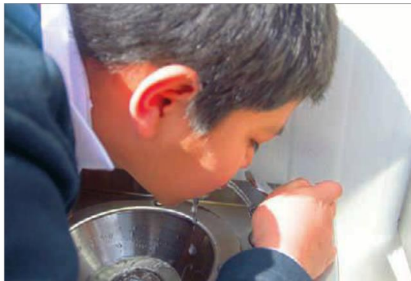
En mayo de 2014 se publicó el decreto para instalar bebederos en las escuelas.

En el país existen alrededor de 145 mil escuelas públicas del nivel básico, más 28 mil escuelas privadas —de las cuales no se tienen datos sobre la instalación de bebederos—. De acuerdo al propio INIFED, en 2014 se instalaron mil 175 bebederos y en 2015 —ya con presupuesto etiquetado proveniente de lo recabado por el impuesto a bebidas azucaradas, implementado en 2014— mil 500 más, como parte del Programa Escuelas Dignas, y que se sumaban a las escuelas que ya contaban con el servicio (incluso aunque no funcionarían) desde 2013 y repre-