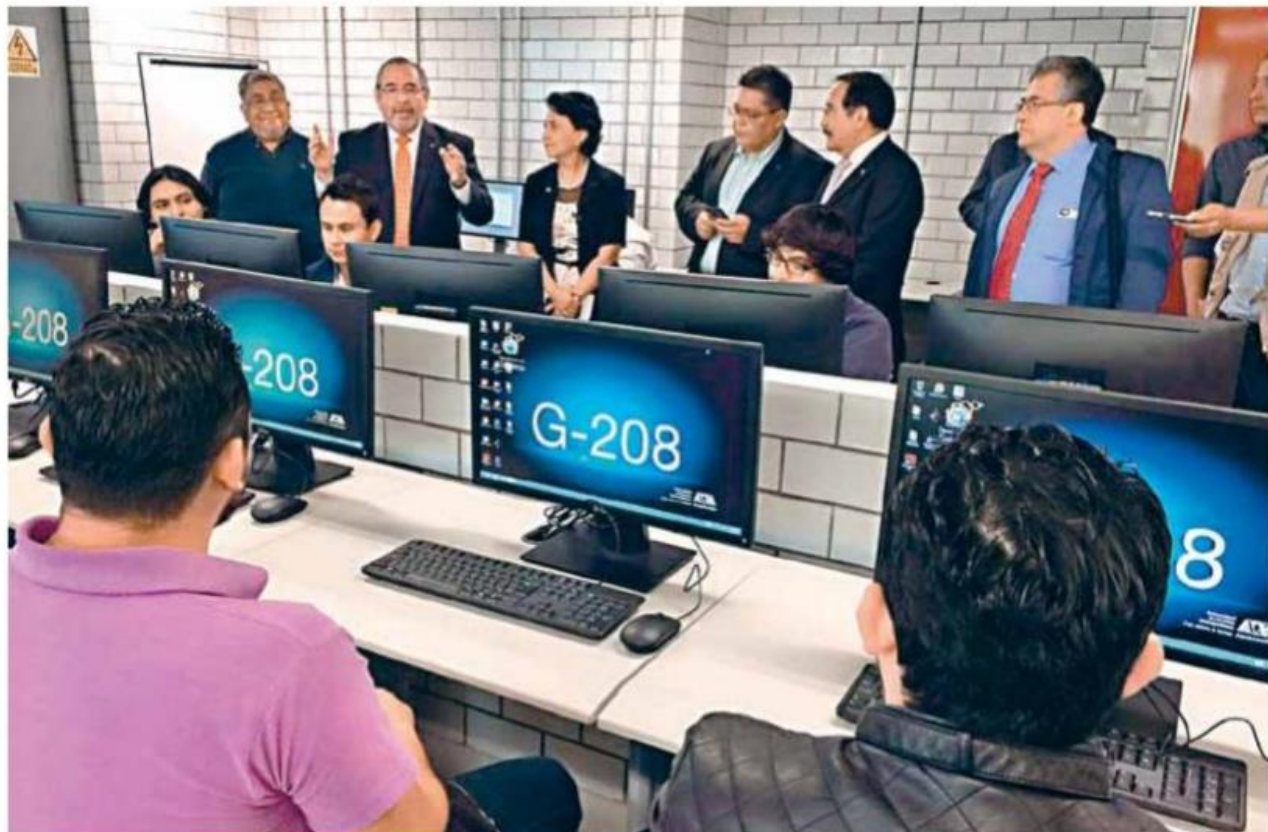
El rector general, Salvador Vega y León, destacó el trabajo del director de Obras de la UAM, Xavier Palomas Molina.

Luego de 29 meses de trabajo la edificación de ocho mil metros cuadrados fue reabierta para iniciar las actividades académicas del trimestre 17 Primavera, y ha implicado un costo de poco más de 197 millones de pesos. La segunda etapa estará lista el 31 de julio de