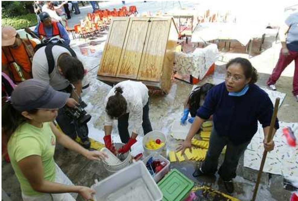
MADRES DE FAMILIA, MAESTRAS Y TRABAJADORAS DE LA GAM LIMPIARON AYER LOS SALONES Y EL MOBILIARIO DEL JARDÍN DE NIÑOS JOSEFA ORTIZ DE DOMÍNGUEZ, TRAS LA TROMBA DEL PASADO VIERNES.