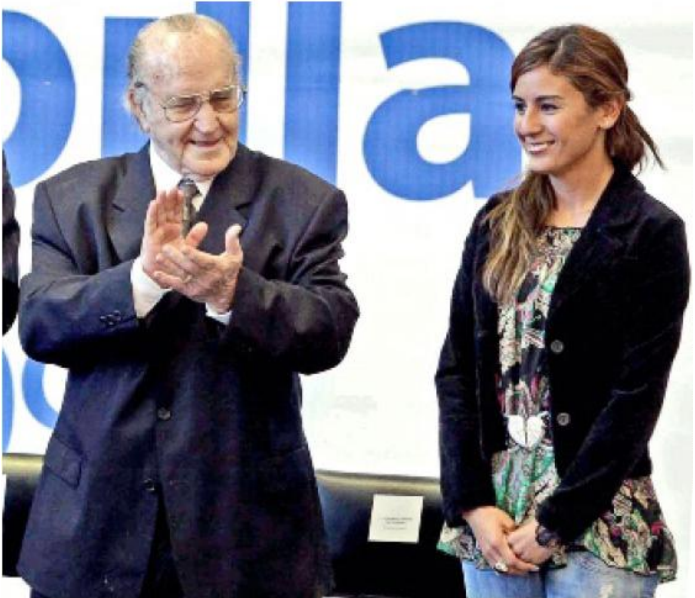
Pasado y presente... Joaquín Capilla y Paola Espinosa, figuras de los clavados mexicanos, estarán en la ceremonia del PND.