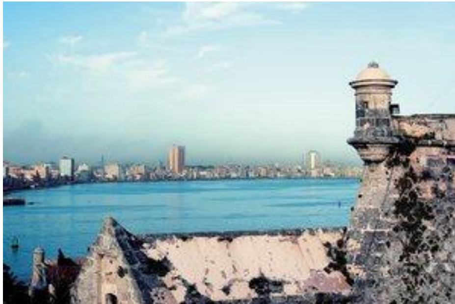
SISTEMA DEFENSIVO. Existen más de 50 fortificaciones en 18 países

Más de 50 fortificaciones en 18 países de Caribe constituyen el mayor sistema defensivo de su tipo en el mundo. Se trata de un patrimonio que data del siglo XVI y que es eje de la serie de documentales El Caribe fortificado que el 8 de noviembre comienza a transmitir Canal 22, los domingos a las 20 horas.