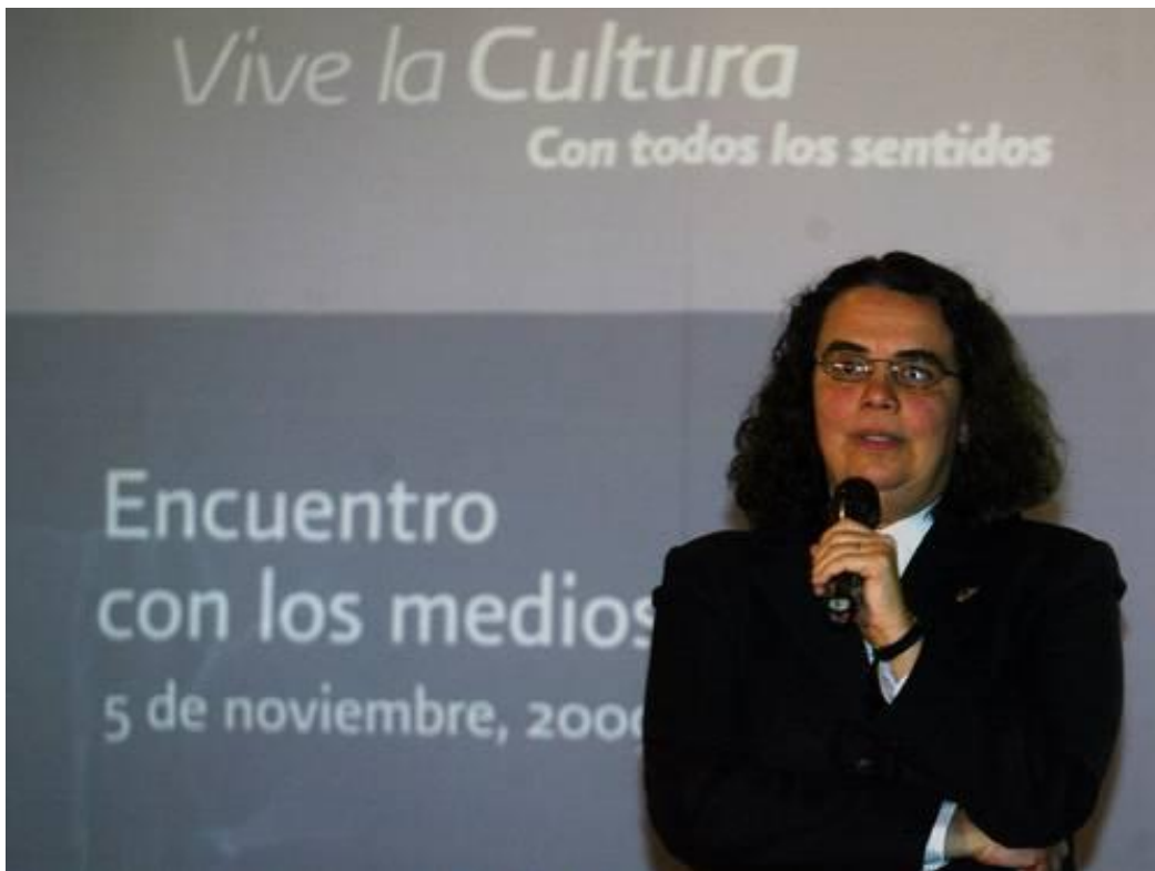
CONSUELO SÁIZAR, TITULAR DEL CONSEJO NACIONAL PARA LA CULTURA Y LAS ARTES, AYER, DURANTE LA CHARLA QUE SOSTUVO CON LOS REPRESENTANTES DE LOS MEDIOS DE COMUNICACIÓN. MÓNICA MATEOS-VEGA

La presidenta del Consejo Nacional para la Cultura y las Artes (CNCA), Consuelo Sáizar, anunció ayer una reestructuración de esa dependencia rectora de la política cultural en el país para afrontar la crisis económica.