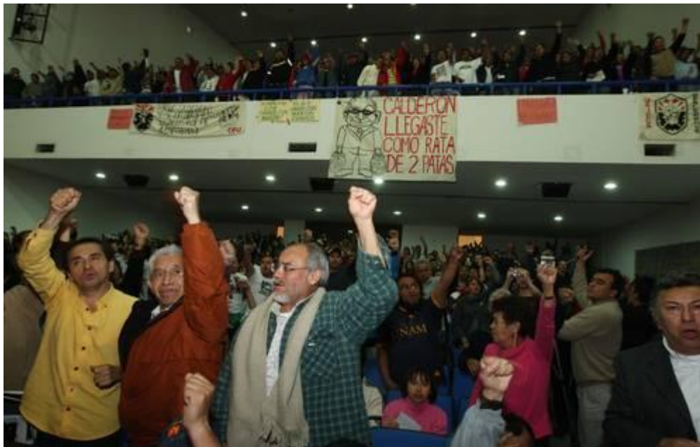
ASISTENTES A LA ASAMBLEA DE LA RESISTENCIA POPULAR BRINDAN SU APOYO TOTAL A LOS ELECTRICISTAS.

• Participarán sindicalistas, campesinos, maestros y estudiantes