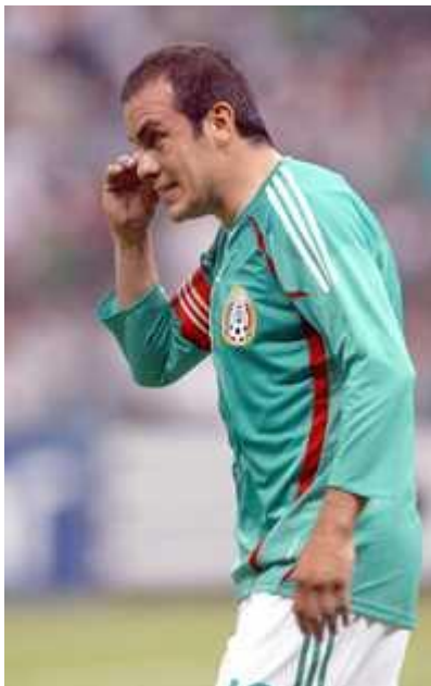
CUAUHTÉMOC BLANCO CONSIDERÓ UN HONOR RECIBIR LA DISTINCIÓN.