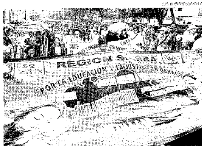
Las autoridades preparan dispositivos de seguridad en el primer cuadro

Aclaró que el dispositivo abarcará el primer cuadro del centro histórico, y se echará mano de policías de proximidad social, mismo que sólo tienen la instrucción, de dialogar, antes que reprimir. ■ M