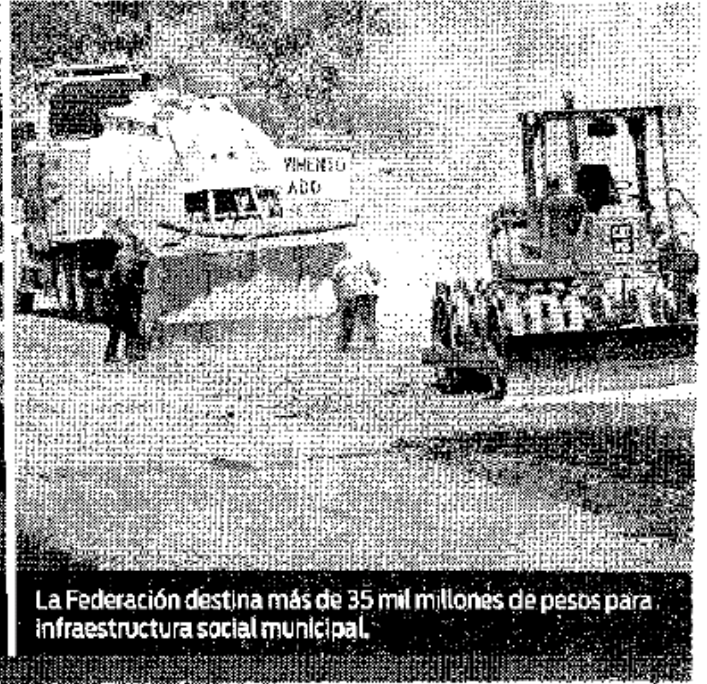
La Federación destina más de 35 mil millones de pesos para infraestructura social municipal.