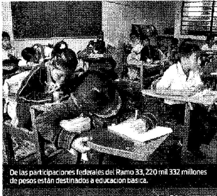
De las participaciones federales del Ramo 33, 220 mil 332 millones de pesos están destinados a educación básica.

Los principales recursos de los ayuntamientos provenientes de la Federación se transfieren a través de tres esquemas o mecanismos: Gasto para su ejercicio libre (Ramo 28, ); Gasto para actividades específicas (Ramos 25 y 33), y Gasto por convenios de programas específicos (Ramo 26). Según datos del INEGI, las participaciones federales representan cerca del 50% del total de las percepciones de las localidades.