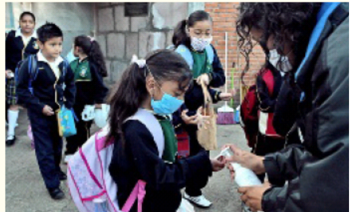
> Los filtros escolares regresaron a las escuelas, ante el repunte de casos de Influenza A H1N1.