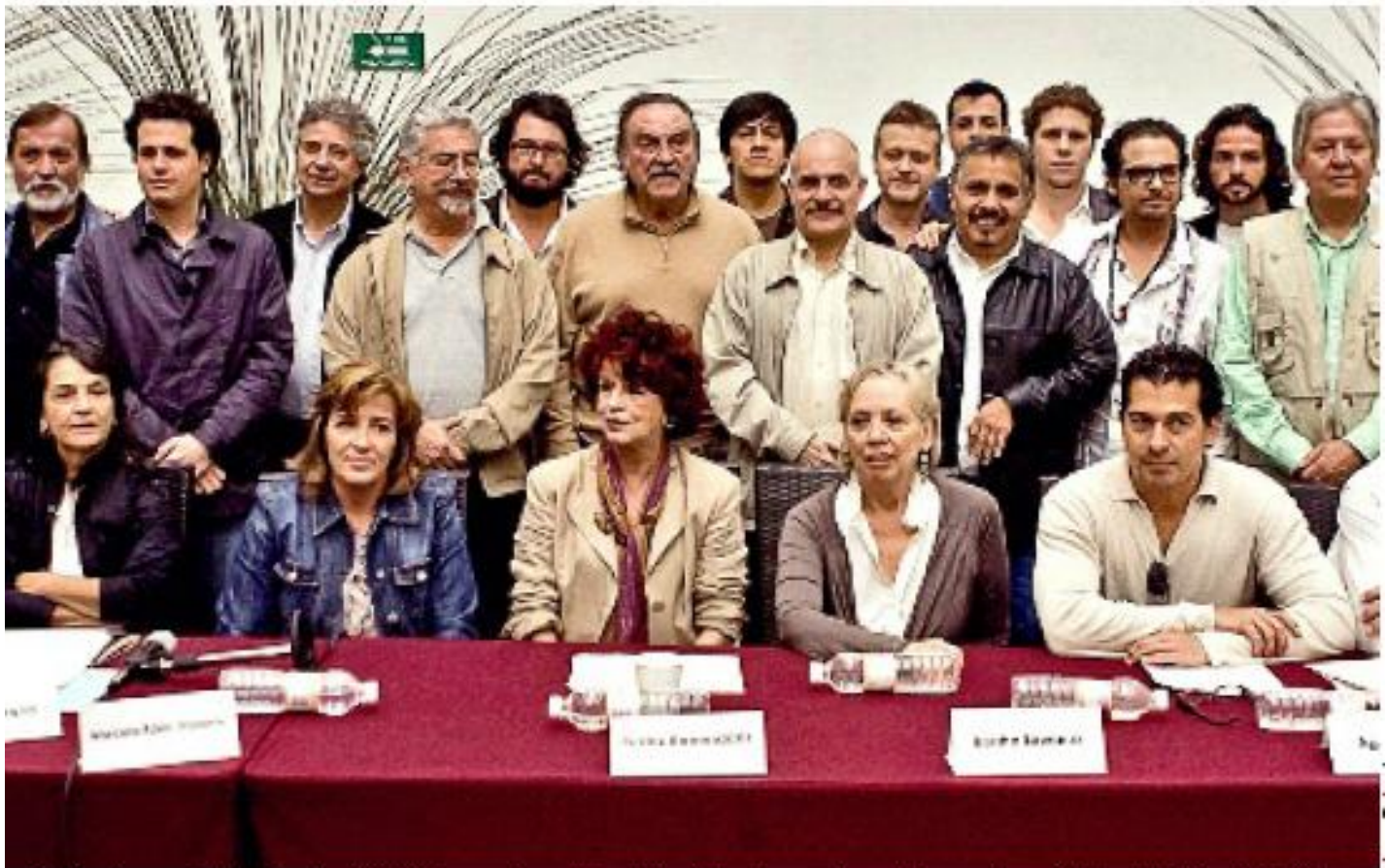
> Pedro Armendáriz (centro) habló a nombre de la industria cinematográfica contra el ejercicio fiscal 2010.