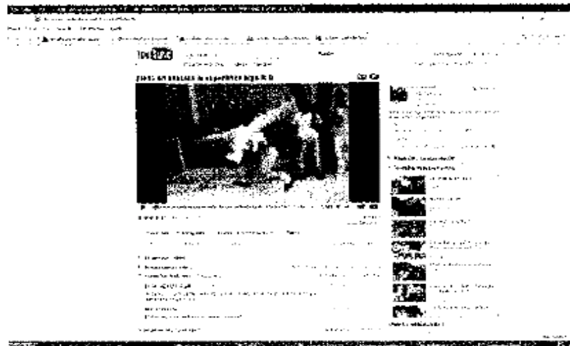
PREOCUPACIÓN. Jóvenes de bachillerato dedican muchas horas de "diversión" a observar videos en internet, reveló una encuesta

En esa misma encuesta, se identificó que un poco más de 7% de los estudiantes de bachillerato a nivel nacional, alrededor 260 mil, declararon que en algún momento han intentado suicidarse. "Es un dato muy