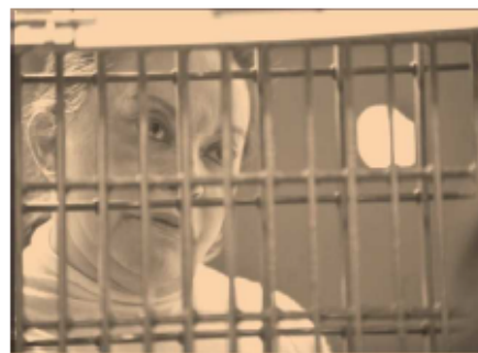
La Maestra se encuentra detenida desde febrero del 2013.

Adelantó que el próximo martes, esta organización solicitará a todos los candidatos que se manifiesten si van a comprometerse con una ampliación y profundización de la reforma educativa.