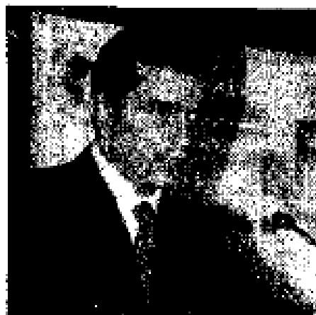
» ALONSO Lujambio.

Durante su gira de trabajo, el secretario de Salud visitará el Consejo de las Américas, con sede en Nueva York, el cual es un foro de difusión en el que líderes, hombres de negocios, analistas financieros, estudiantes y el público en general del Continente Americano analizan políticas públicas que afectan o benefician a la región.