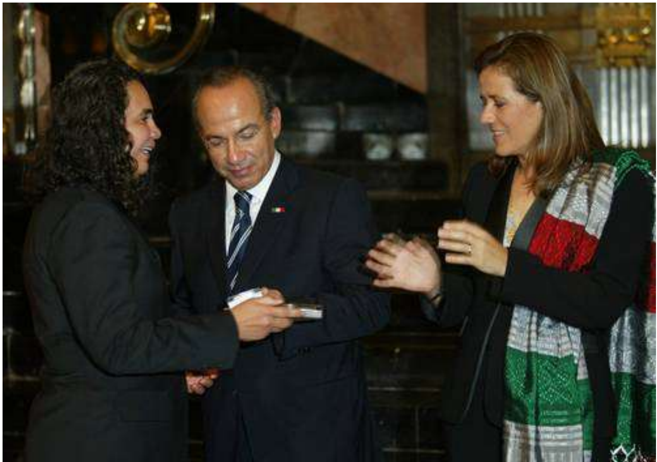
EN BELLAS ARTES. CONSUELO SÁIZAR, DEL CONSEJO NACIONAL PARA LA CULTURA Y LAS ARTES; EL PRESIDENTE FELIPE CALDERÓN Y SU ESPOSA, MARGARITA ZAVALA, DURANTE LA INAUGURACIÓN DE LA EXPOSICIÓN EL GRECO 1900 , AYER EN EL PALACIO DE BELLAS ARTES